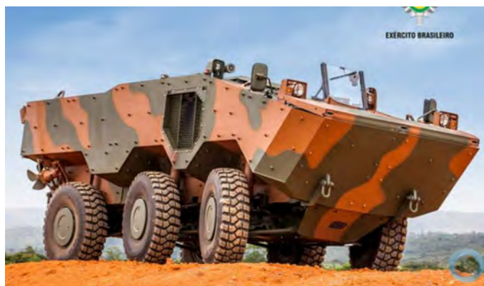
Figura 01: A VBTP – MR 6x6 Guarani

A Viatura Blindada para Transporte de Pessoal Média sobre Rodas (VBTP – MR) Guarani é um veículo blindado, sobre rodas, com possibilidade anfíbia e tração nas suas seis rodas, capaz de transportar até 11 militares. Suas dimensões são 6,91 metros de comprimento, 2,70 metros de largura e 2,34 metros de altura.