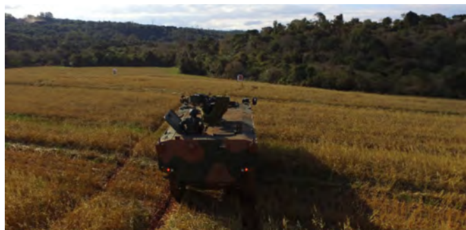
Fotografia 04: Cadete do C Inf utilizando armas da Vtr Guarani