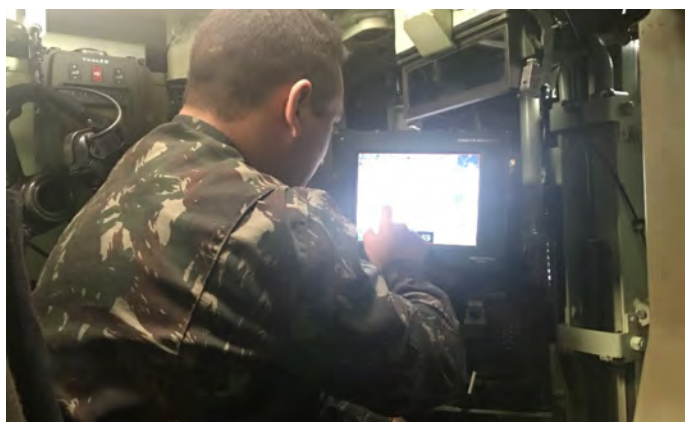
Fotografia 01: Cadete do C Inf utilizando o GCB 1 da Vtr Guarani