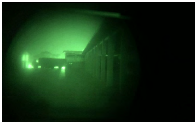
Fotografia 02: Cadete do C Inf utilizando EVN 2

Ao final, com a última passagem do relatório, fica nítida a importância da experiência colhida pelos Cadetes. Notamos, ainda, que os cadetes trataram de forma fidedigna os acontecimentos e a importância do ganho obtido com o contato com a Inf Mec para o futuro do Exército. Com isso, para exemplificarmos, de forma completa, o ganho militar dos Cadetes, serão apresentadas imagens de algumas atividades desenvolvidas por cadetes do C Inf.