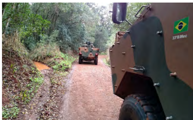
Fotografia 05: Cadetes do C Inf em uma Marcha para o Combate com a Vtr Guarani