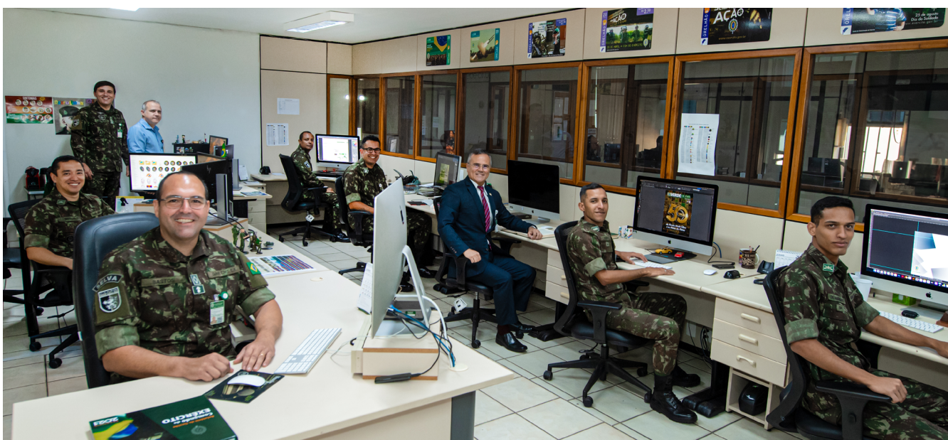
Seção de Design Gráfico em 2023