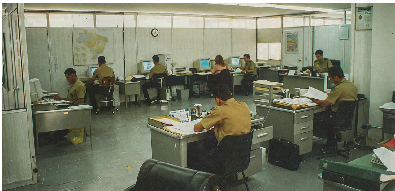
Divisão de Produção e Divulgação nos anos 90