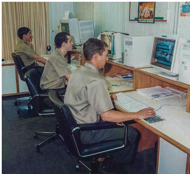
Equipe de criação nos anos 90

Currently, the Verde-Oliva magazine personnel is trying hard to improve the next editions, taking inspiration from the legacy of its preceding editors and preserving its credibility and prestige among its readers.