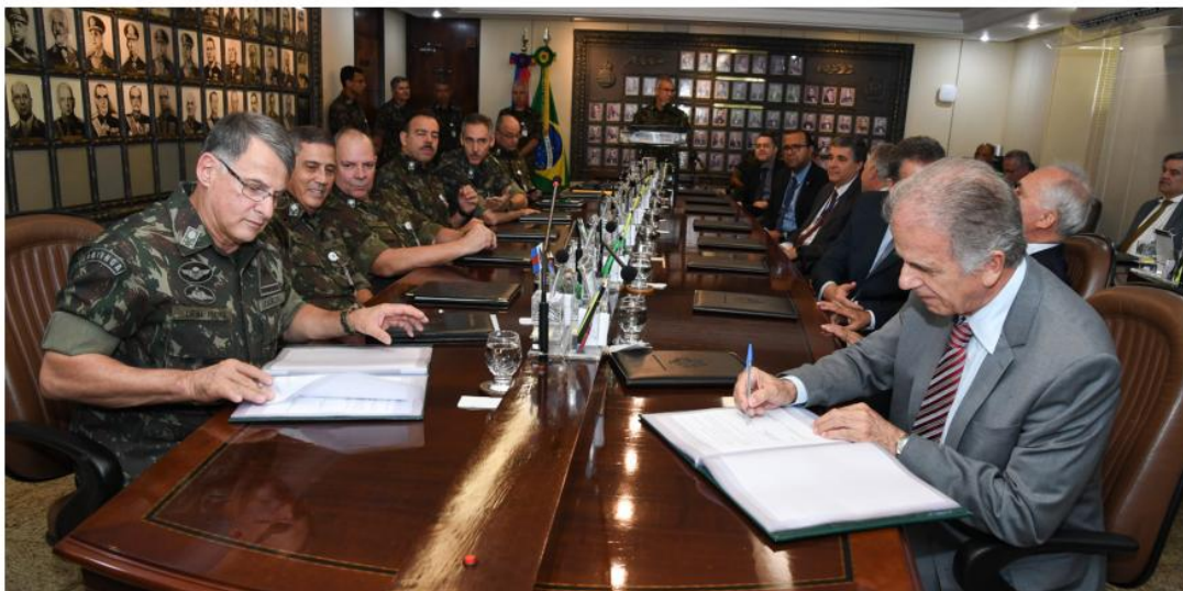
Assinatura de cooperação entre o Exército Brasileiro e o Tribunal de Contas da União.

promoção do diálogo para influenciar, de forma legal e legítima, o processo decisório que poderá repercutir na organização, sendo um instrumento essencial da comunicação estratégica do Exército Brasileiro.