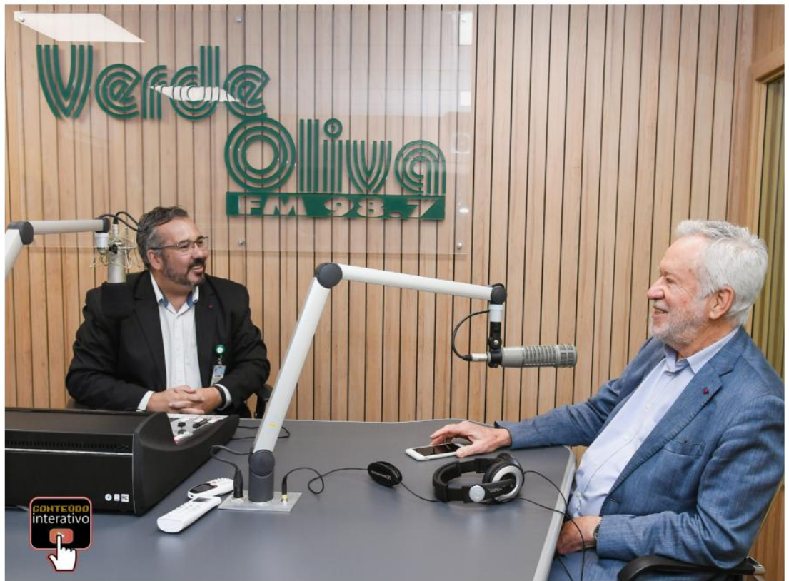
Entrevista do jornalista Alexandre Garcia à Rádio Verde-Oliva.