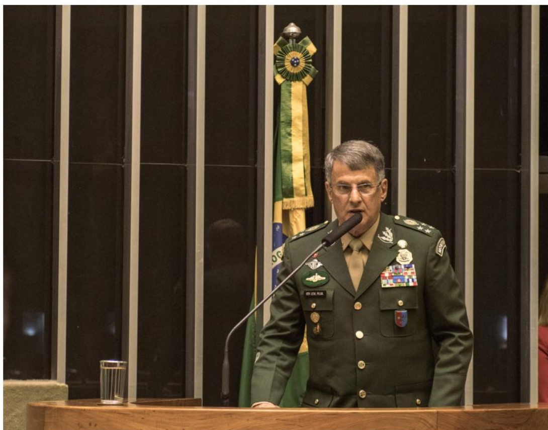
Solenidade na Câmara dos Deputados em homenagem ao Dia do Exército.

O exercício das atividades de relações institucionais para o Exército tem como propósito oferecer informações qualificadas aos agentes públicos e privados, com vistas a alcançar os objetivos definidos para a Força Terrestre, e que concorram para o cumprimento da missão definida na Constituição.