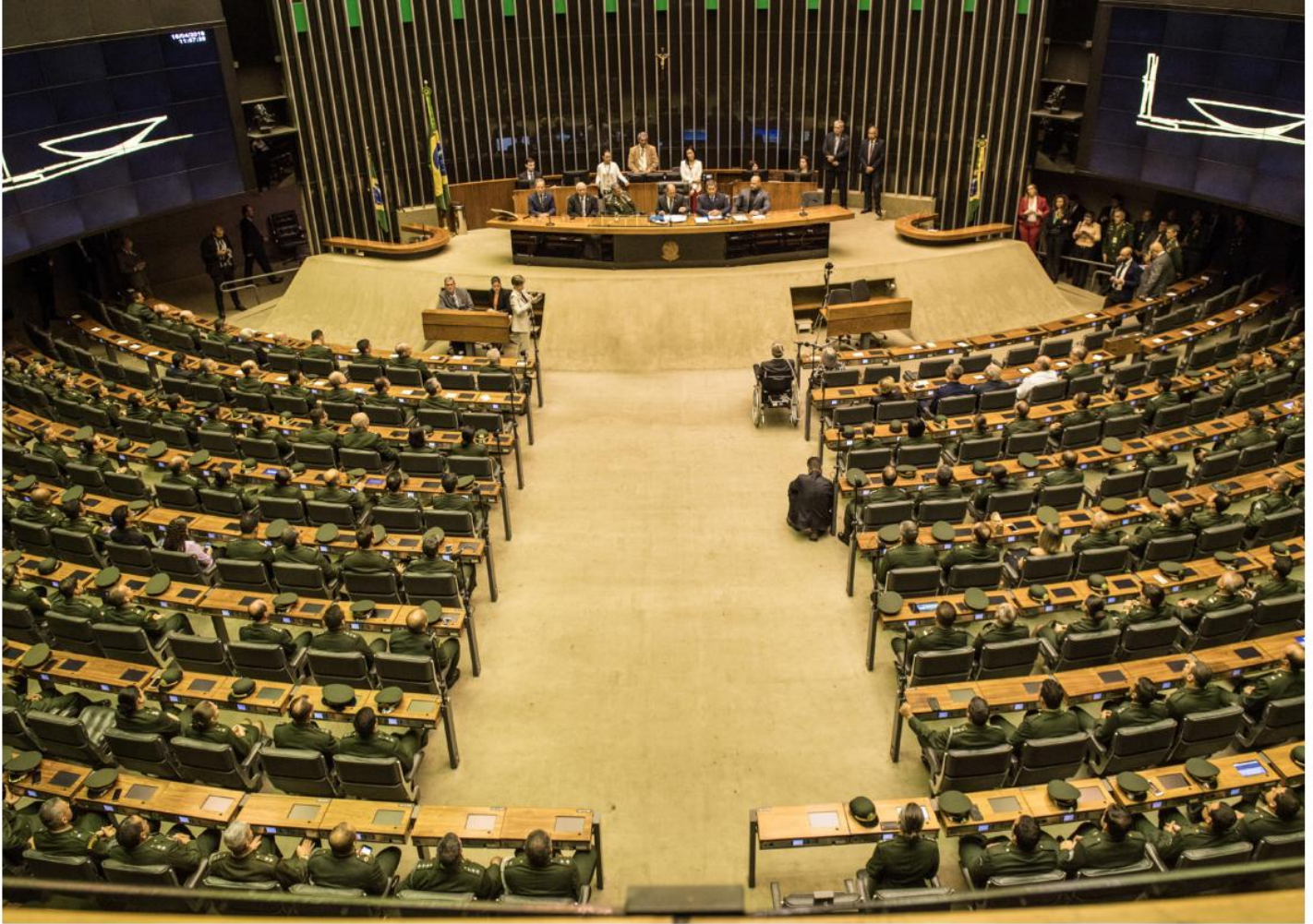
Solenidade na Câmara dos Deputados em homenagem ao Dia do Exército.

A Assessoria Parlamentar (A/4) trata dos assuntos relacionados ao Poder Legislativo Federal, visando garantir um amparo legal para a atuação do Exército Brasileiro no cumprimento de suas missões constitucionais. Ela promove, também, o entendimento de senadores e deputados federais sobre as características da carreira militar e tenta convencer os congressistas a respeito da necessidade de destinação de recursos financeiros à Força, por intermédio de emendas parlamentares. Além disso, a A/4 estabelece uma ligação com a Assessoria Parlamentar do Ministério da Defesa e um canal técnico com as assessorias parlamentares dos Comandos Militares de Área, integrando e constituindo um sistema de relações institucionais para acompanhar a elaboração, discussão e votação dos projetos legislativos que impactam diretamente a instituição.