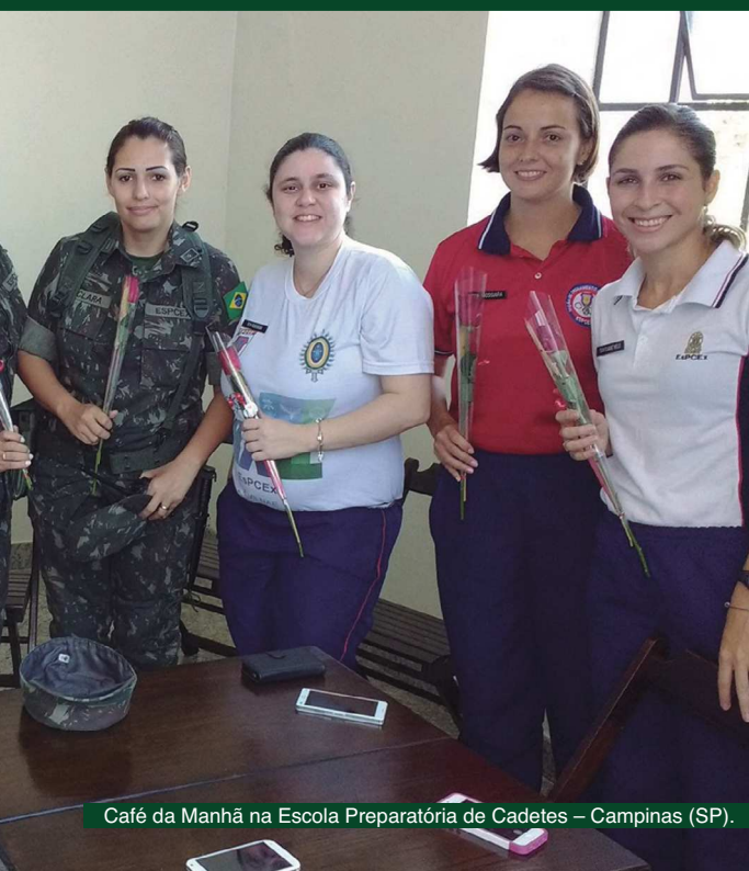
Café da Manhã na Escola Preparatória de Cadetes – Campinas (SP).