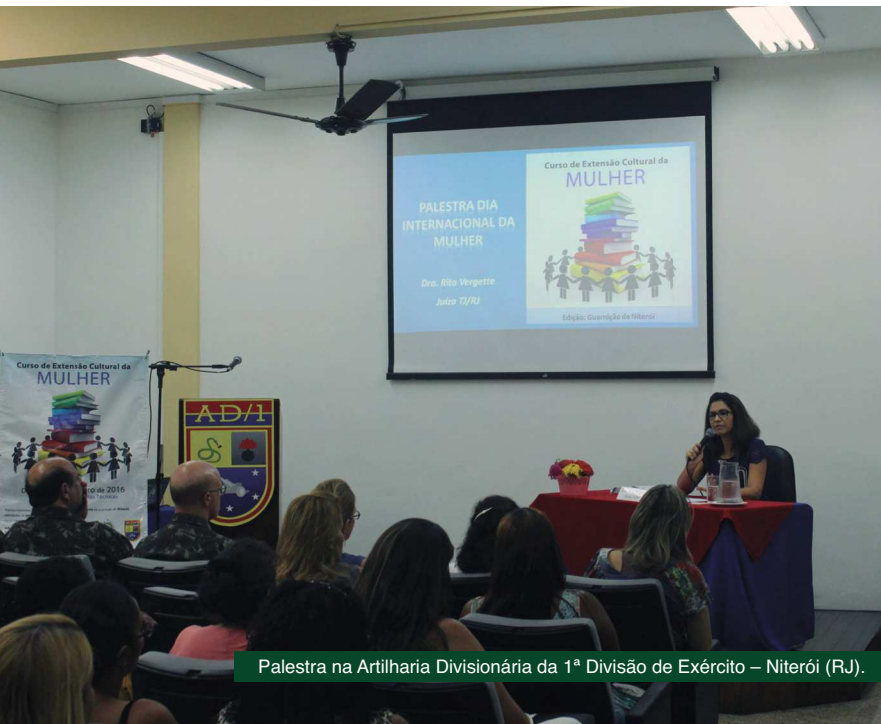
Palestra na Artilharia Divisionária da 1ª Divisão de Exército – Niterói (RJ).