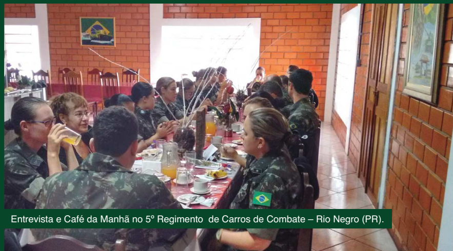
Entrevista e Café da Manhã no 5º Regimento de Carros de Combate – Rio Negro (PR).