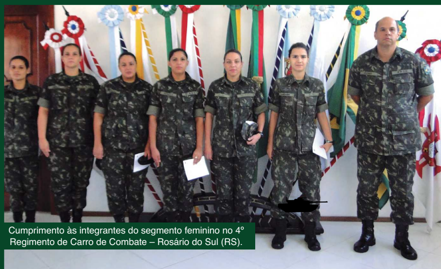
Cumprimento às integrantes do segmento feminino no 4º Regimento de Carro de Combate – Rosário do Sul (RS).