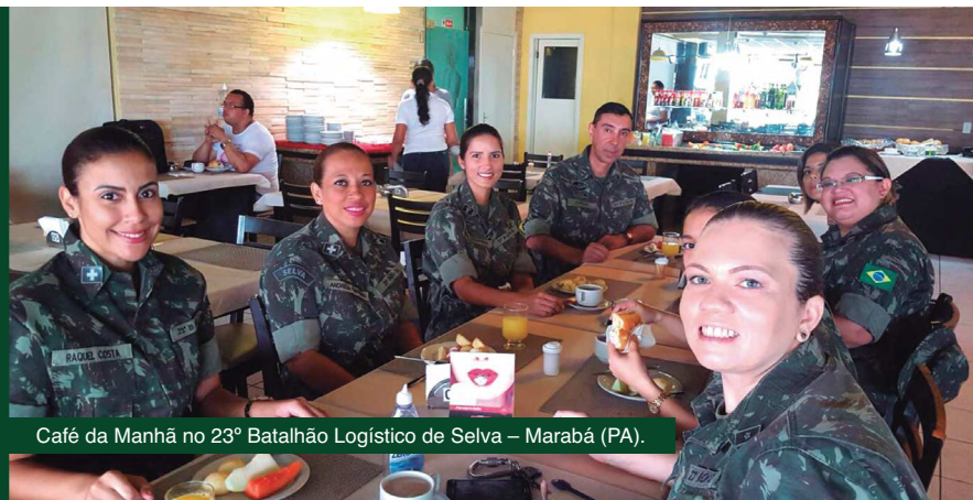
Café da Manhã no 23º Batalhão Logístico de Selva – Marabá (PA).