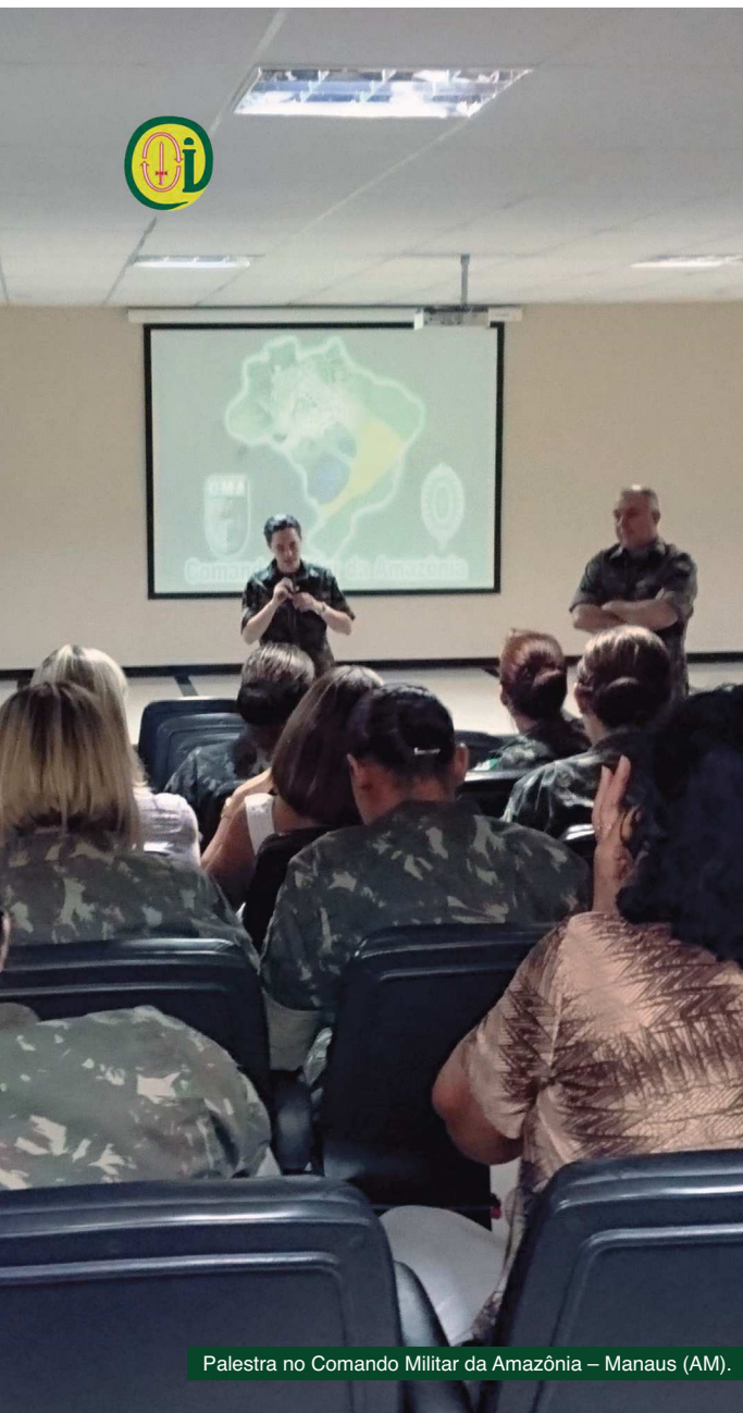
Palestra no Comando Militar da Amazônia – Manaus (AM).