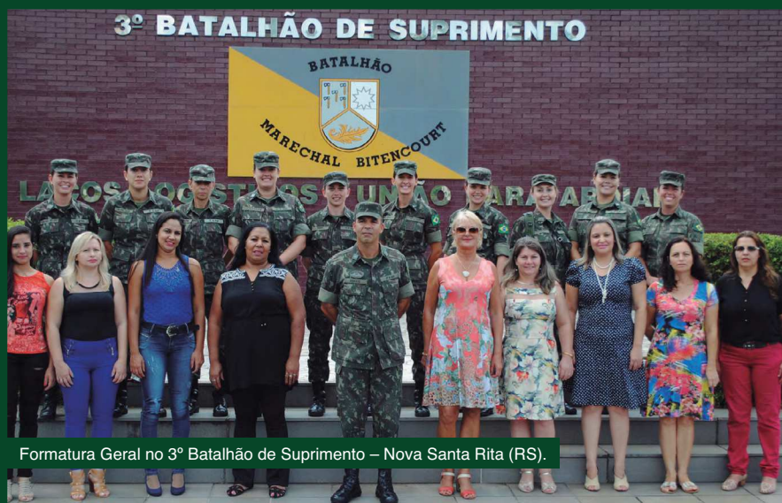
Formatura Geral no 3º Batalhão de Suprimento – Nova Santa Rita (RS).