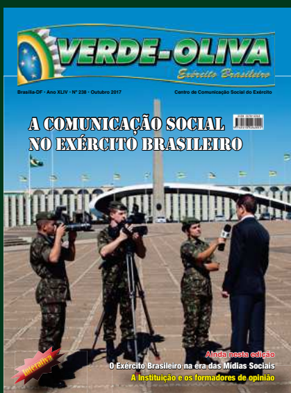
Agentes de Comunicação Social do Exército em ação.

VERDE-OLIVA – ANO XLIV • Nº 238 • OUTUBRO 2017