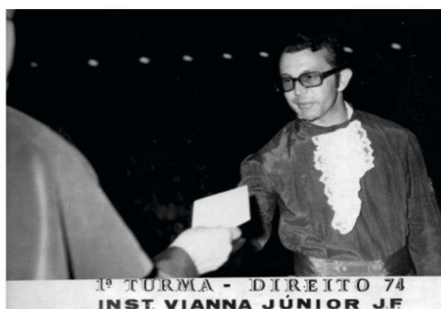
Figura 6 - Colando grau como Bacharel em Direito, em Juiz de Fora.