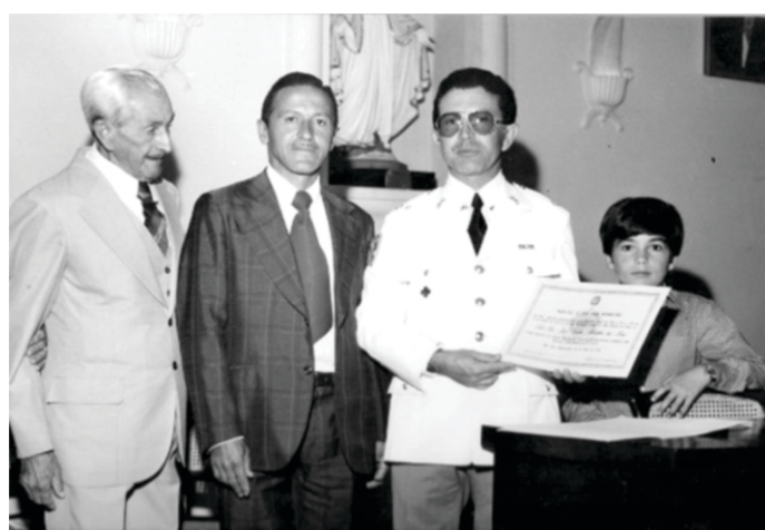
Figura 5 - Recebendo o título de Cidadão Honorário São Joanense, na Câmara Municipal.