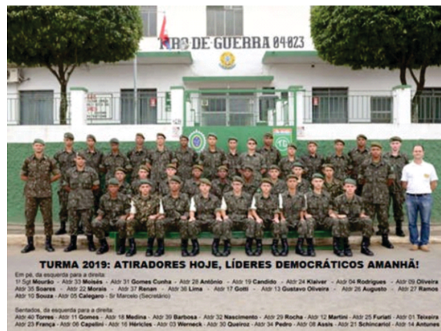
Figura 10 - Formandos da Turma de 2019: Atiradores Hoje, Líderes Democráticos Amanhã!