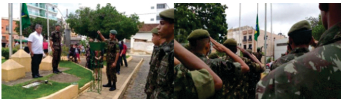
Figura 22 - Dia da Bandeira