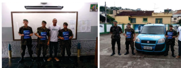
Figura 23 - Distribuição de Bolsas de Estudos para o concurso da ESA(2020).

Além disso, foram cedidas 07 (sete) bolsas de estudo, com o intuito de preparar os Atiradores para o concurso da Escola de Sargentos das Armas (ESA), no ano de 2020: