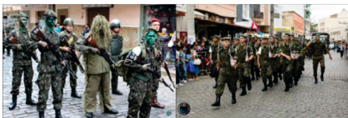
Figura 16 - Dia da Independência.