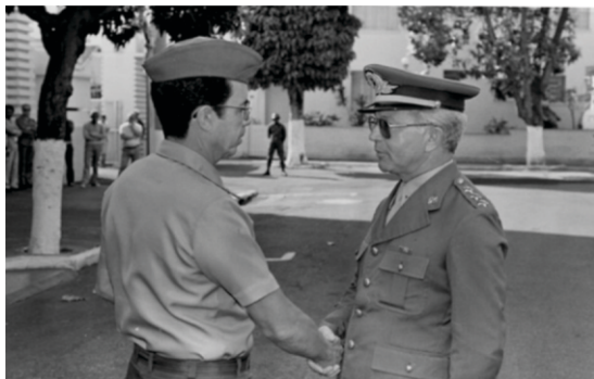
Figura 7 - Já Capitão do Exército, por ocasião de seu ingresso na Reserva.