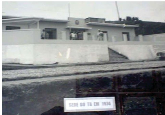
Figura 4 - A sede do então TG 151, em SJN, inaugurada em 1974, durante a sua Chefia.