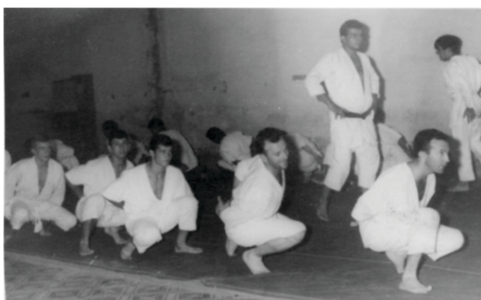
Figura 2 - Numa aula de judô, durante o seu período inicial de formação militar.