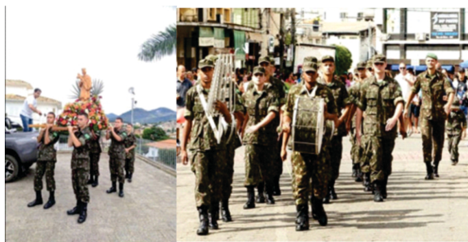
Figura 14 - Dia do Município São Joanense.

Após o evento anterior, a tropa realizou o Desfile Cívico e entoou a Canção do Exército, postando-se em frente ao palanque, onde estavam as Autoridades em posição de destaque. Em seguida, os Atiradores completaram o restante do itinerário do Desfile e foram liberados por volta das 11:00h: