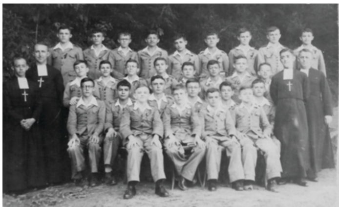
Figura 1 - Estudante do Colégio dos Irmãos Maristas, Mercês, Rio de Janeiro.

marcantes que passaram pela história do serviço militar de São