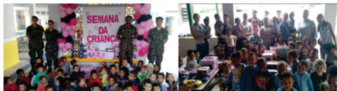
Figura 19 - Campanha do Brinquedo (2ª Distribuição).