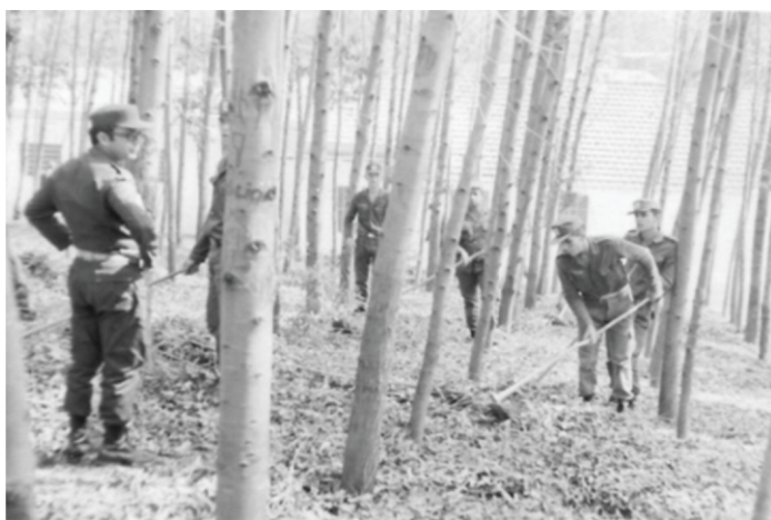
Figura 3 - Instruindo seus comandados, no TG de São João Nepomuceno.