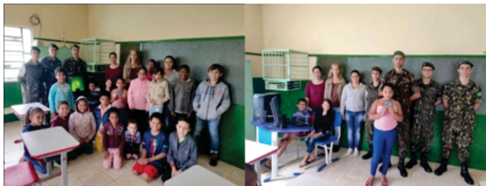
Figura 16 - Doação do 1º Computador montado com o Lixo Eletrônico recolhido.