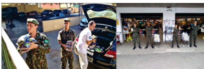
Figura 17 - Campanha do Alimento.

No dia 9 de setembro de 2019, este Órgão de Formação da Reserva distribuiu os alimentos arrecadados na Campanha do Alimento para as seguintes Instituições da cidade Garbosa: Lar Ambrosina de Mattos (212kg); Associação Feminina de Prevenção e Combate ao Câncer - ASFECER (212kg); Associação Pestalozzi (150kg); Sociedade São Vicente de Paula (100k g); e 4 cestas básicas doadas avulso: