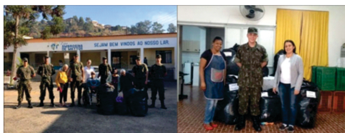
Figura 15 - Campanha do Agasalho.