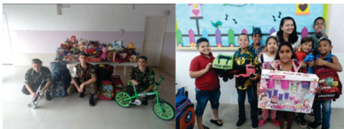
Figura 18 - Campanha do Brinquedo (1ª Distribuição).