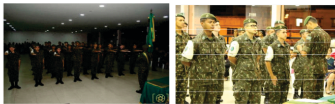
Figura 24 - Formatura de Encerramento de Curso de Formação de Combatente Territorial.

Além disso, houve a promoção à graduação de Cabos, a entrega de diplomas e de prêmios aos destaques do ano de instrução e o descerramento da foto da turma de 2019: