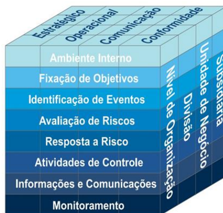
Figura 1 – Modelo de referência COSO representado por seu cubo.

comunicação e conformidade), as unidades da organização e os oito componentes do modelo (COSO, 2007).