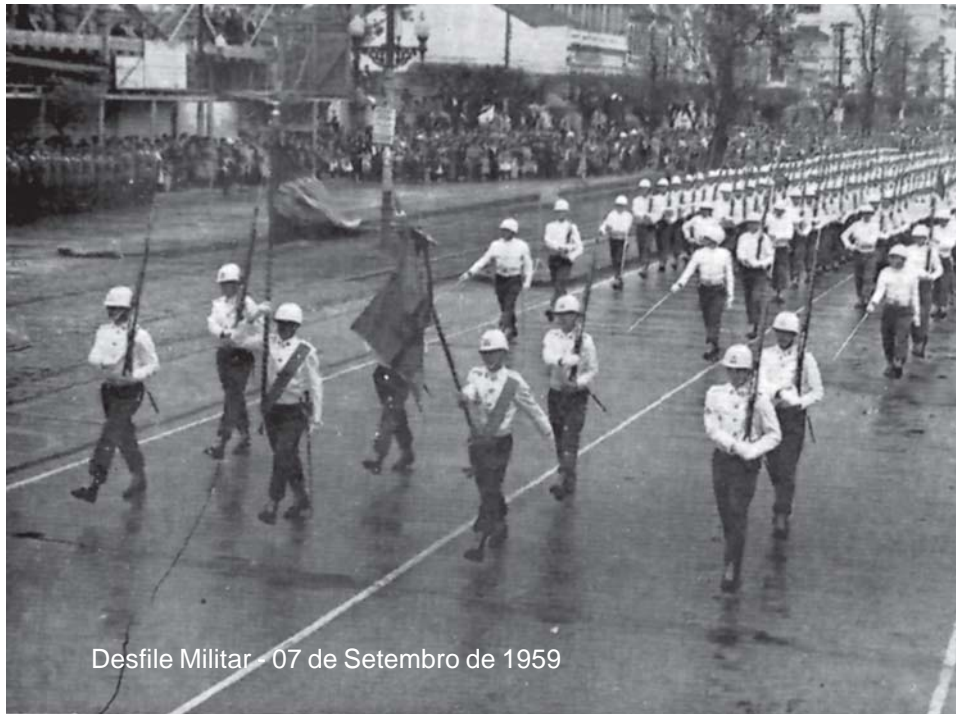
Desfile Militar - 07 de Setembro de 1959

ceia, às 21.00 horas, não era obrigatório. E ao toque de silêncio, às 22:00 horas, a grande maioria dos Alunos já estava na cama.