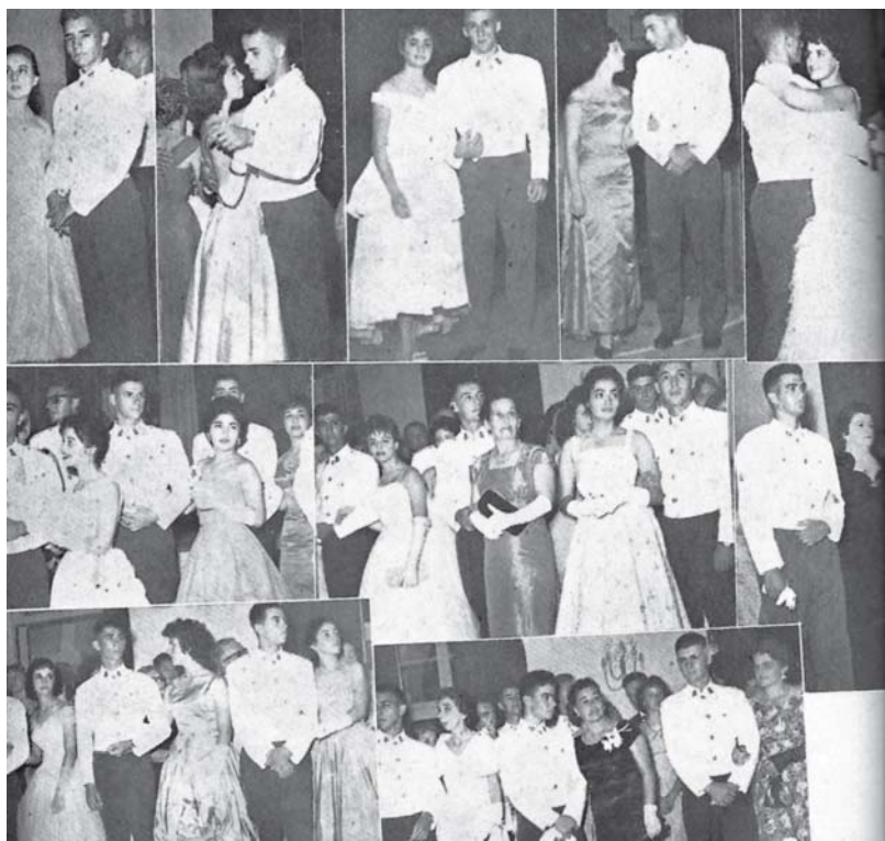
Baile do Adeus

imenso (136 x 63 metros), piso sem revestimento, no seu centro um solitário poste de ferro que servia como mastro interno (atualmente, o pátio está coalhado de canchas esportivas).