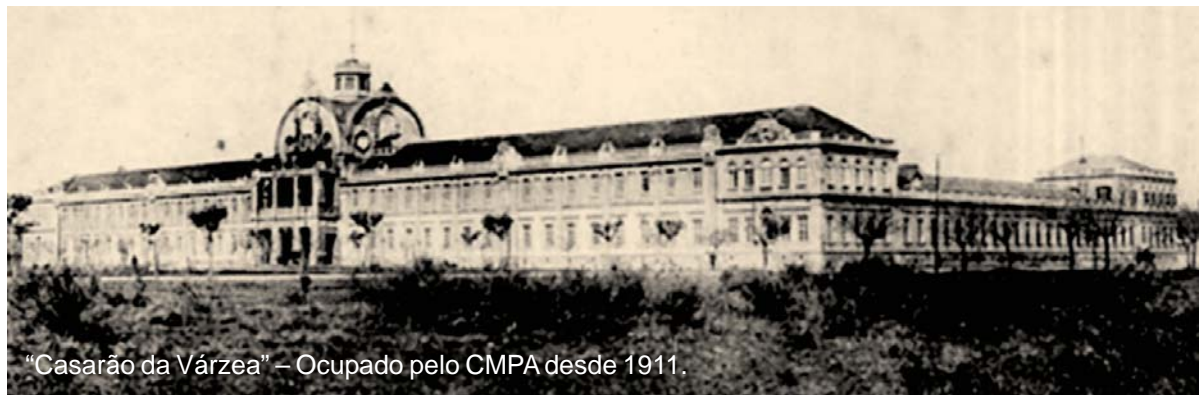
“Casarão da Várzea” – Ocupado pelo CMPA desde 1911.

Guarnecem o saguão de entrada duas magníficas estátuas, ali colocadas no ano de 1914: Marte, ou Ares, deus