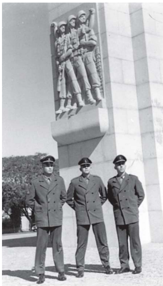
Alunos “Veteranos” no Parque Farroupilha

Os veteranos, tradição que passava de uma para outra geração, sabiam mais, tinham mais experiência, ensinavam e davam exemplo. Honravam o peso das três divisas na manga.