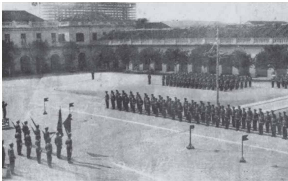
Formatura no pátio

Terminado o desfile, todos para as salas de aula, que começavam às 07.00 horas. O último tempo da manhã era dedicado à Educação Física, as companhias deslocadas para o Estádio do Parque da Redenção.