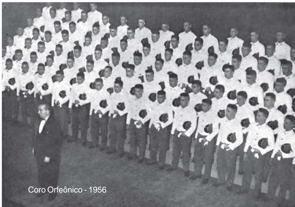
Coro Orfeônico - 1956