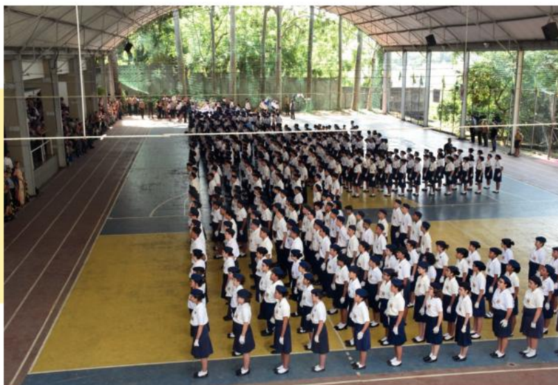
Formatura de chamada