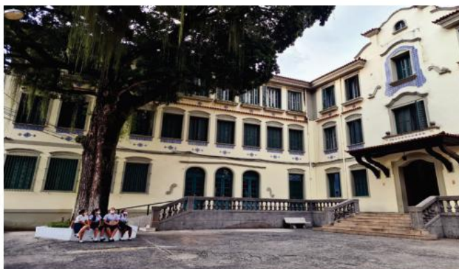
Pavilhão Epitácio Pessoa