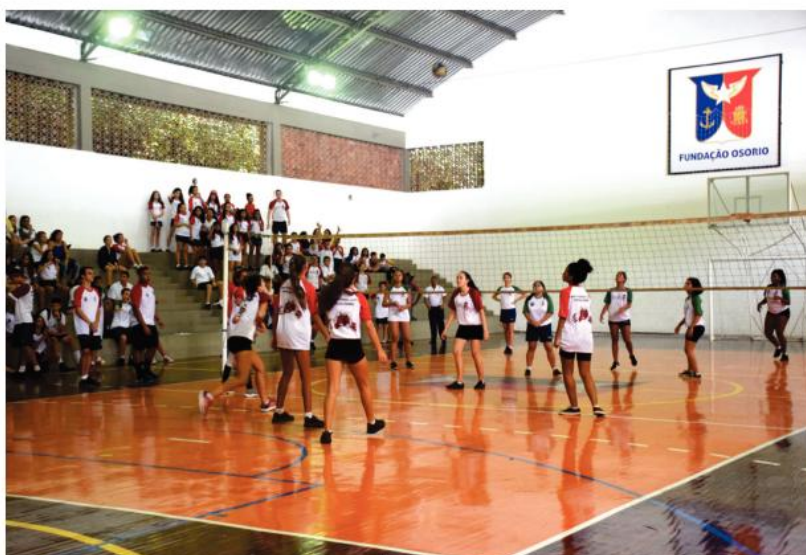
Quadra de esportes Vôlei feminino