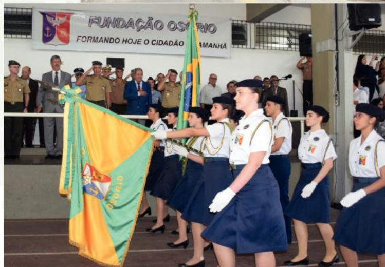
Formatura "em Continência" às Autoridades presentes