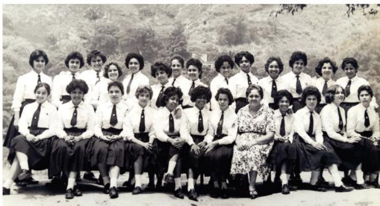
Formandas da 4ª série ginásial -1960