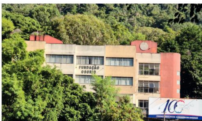
Prédio da Administração

Dessa forma, a Fundação Osorio coloca à disposição de seus alunos amplas salas de aula, laboratório de Ciências Físicas e Biológicas, laboratório de informática, salas de artes e uma biblioteca com acervo de, aproximadamente, 12 mil livros.