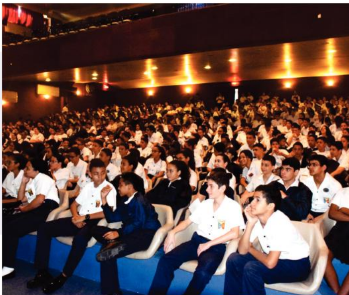
Nosso grande e magnífico auditório