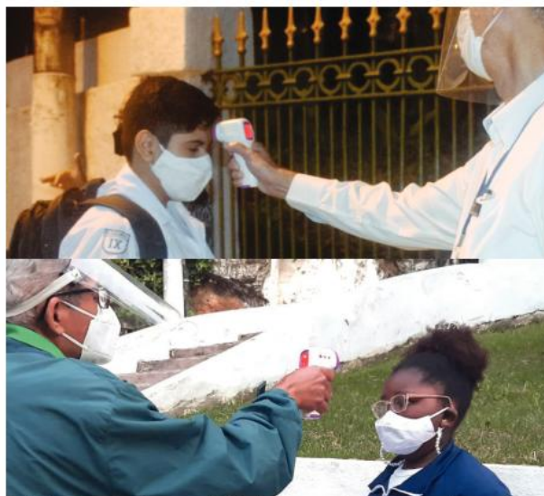
Detalhe importante; a medição da temperatura na entrada

Mesmo com as medidas preventivas implementadas, a atividade-fim sofreu um duro baque com a suspensão das aulas desde o mês de março do ano de 2020. O Corpo Docente se voltou para a busca de alternativas, a fim de continuar trabalhando com nossos alunos. A comunicação a distância, tão necessária nas orientações de ensino, se valia de qualquer veículo disponível naquele momento. Continuamos seguindo, enfrentando problemas e superando obstáculos. O embrião de um “ambiente virtual de aprendizagem”, pequenino, cresceu e ganhou força suficiente para sustentar uma demanda cada vez maior. A disposição dos professores sempre aumentando com os crescentes e continuados desafios. Os especialistas ajudavam aos que não sabiam utilizar plenamente as novas ferramentas tecnológicas, além de uma capacitação técnica ser buscada paralelamente em cursos e estágios. A infraestrutura se fortaleceu; os próprios alunos, pais e responsáveis entenderam que não estávamos parados, além