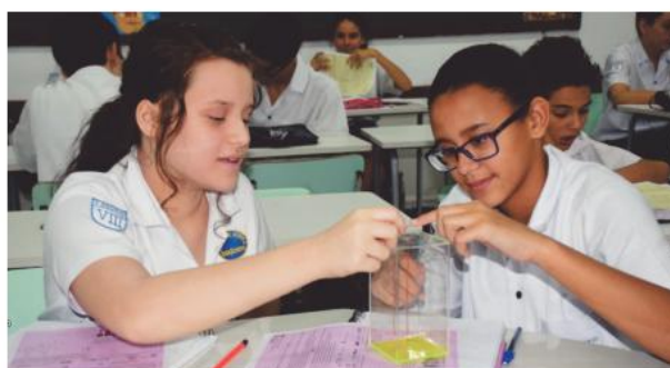
Aula de matemática, futuros “crânios”

disso, perceberam que podiam e deviam colaborar com o enfrentamento da situação. Tornaram-se parceiros nesse esforço hercúleo, quando então os resultados começaram a aparecer.