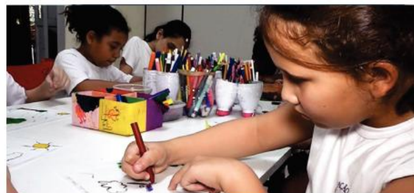
Quanta criatividade na aula de artes