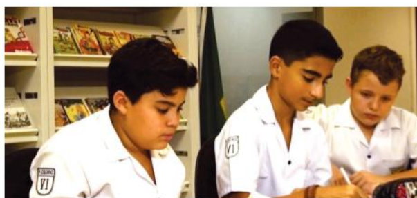
Enfim, a biblioteca presencial