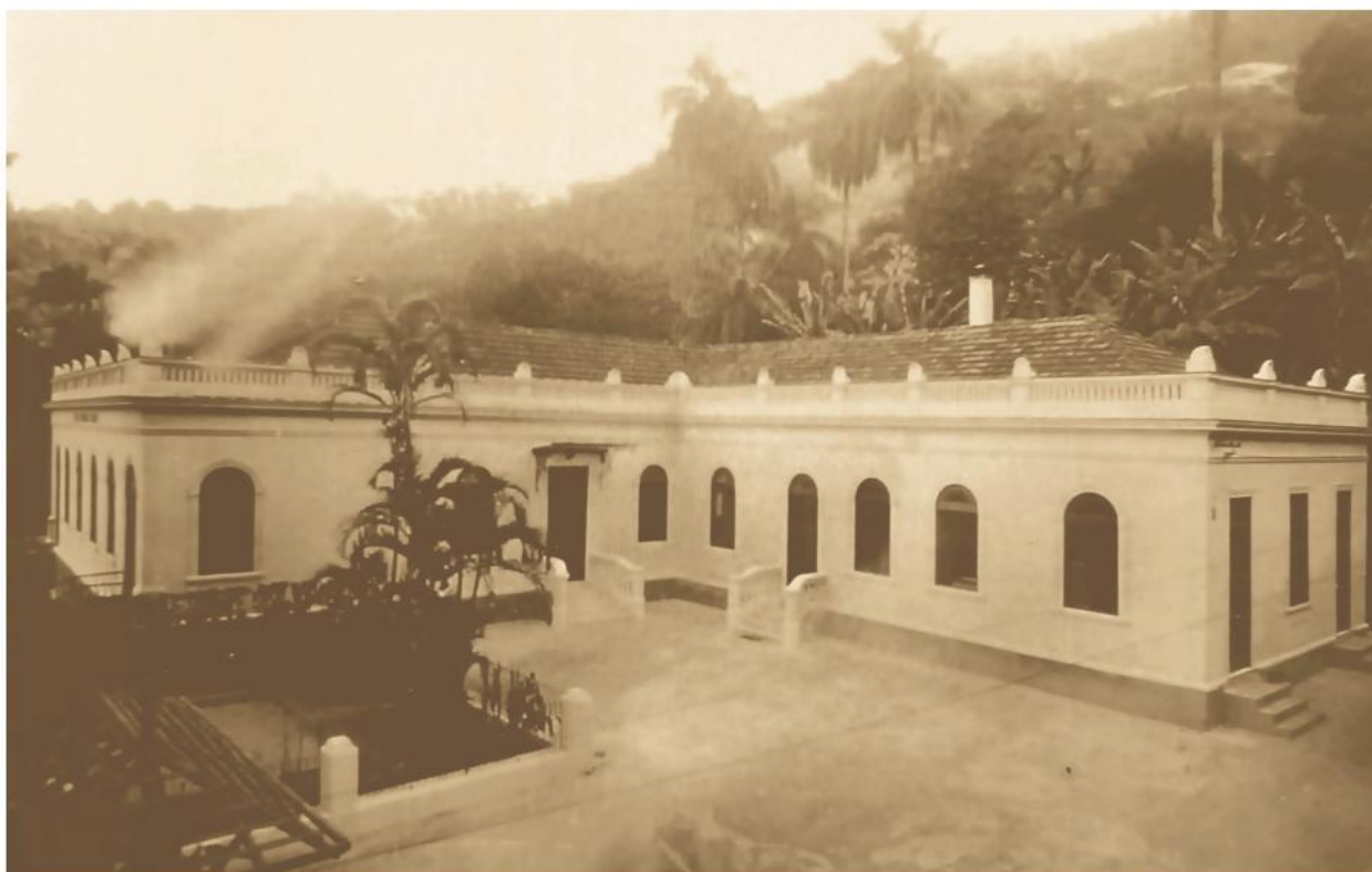
Edificação antiga da Fundação Osorio

A lei 9026, de 10 de abril de 1995, alçou a instituição à categoria de Fundação Pública proporcionando-lhe aumento de receita e melhoria das instalações.