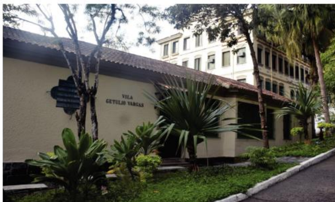
Vila Getúlio Vargas