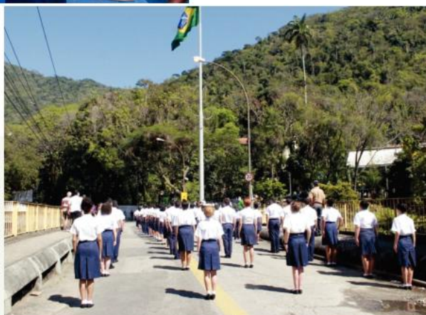
Os alunos perfilados ao Pavilhão Nacional em cerimônia comemorativa do Dia da Bandeira