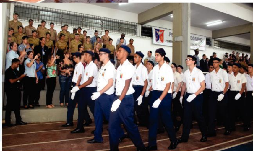
Nos eventos especiais, o desfile dos alunos é o coroamento da cerimônia