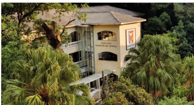
Pavilhão Marquês do Herval Ensino Médio