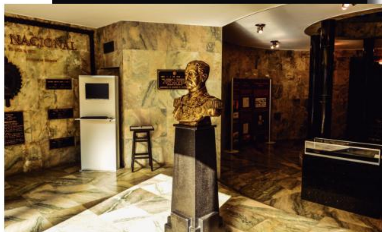
Interior do Pantheon de Caxias, busto de Caxias e sabre da vitória da Guerra do Paraguai

ção de águas pluviais existente, abertura de visita para a abóbada pela área externa e troca de esquadrias danificadas e 3) Implantação da proposta expográfica, que consiste na remodelação do espaço expositivo atual.