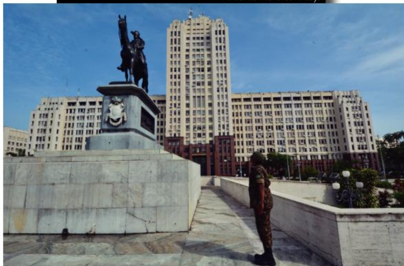
Vista da cobertura do Pantheon de Caxias com Palácio Duque de Caxias ao fundo