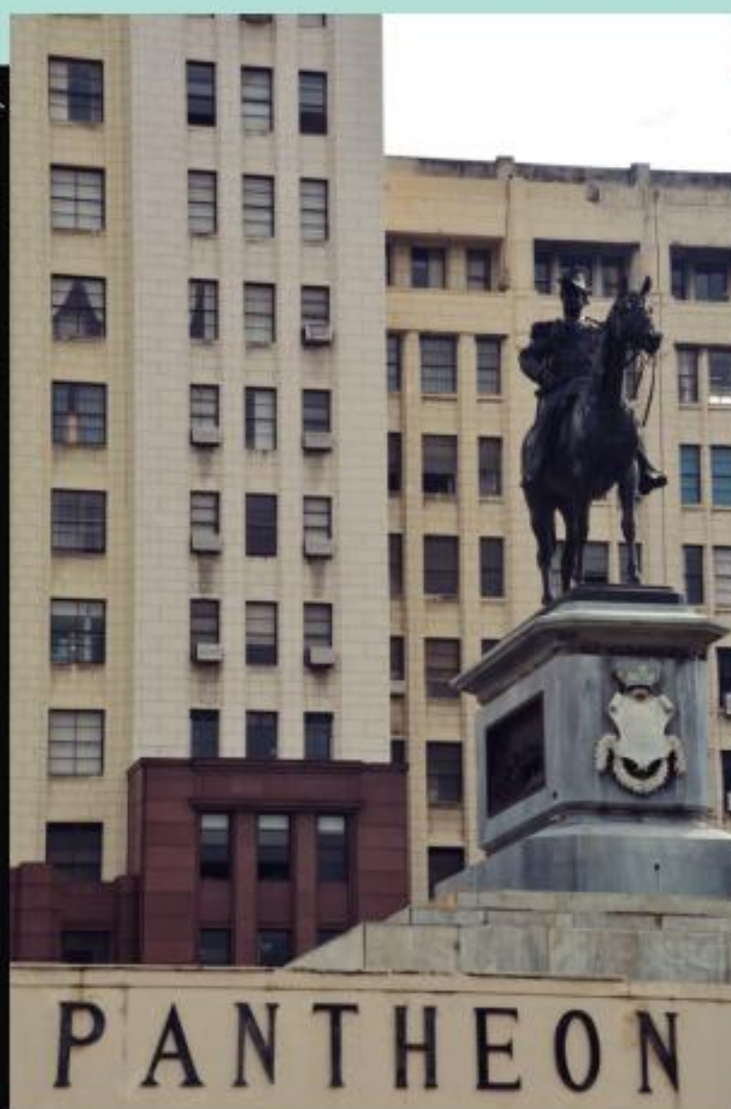
Estátua equestre localizada sobre o Pantheon de Caxias