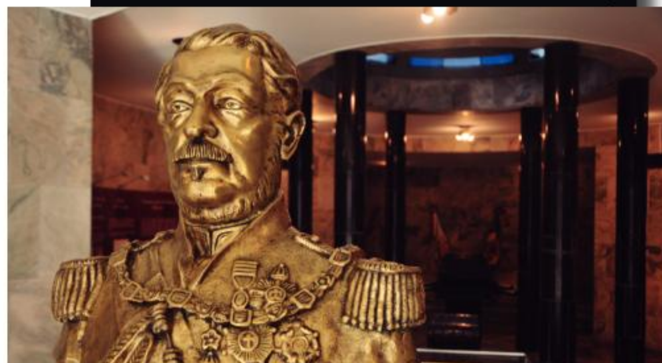
Busto de Duque de Caxias que se encontra no interior do mausoléu

O projeto foi dividido em três atividades: 1) Troca de equipamentos por outros mais modernos; 2) Revisão das instalações elétricas, que deverá ser executada após a elaboração de projeto de instalações elétricas, serviços de impermeabilização de cobertura, troca de revestimentos danificados em toda a edificação, reforma do sistema de capta-