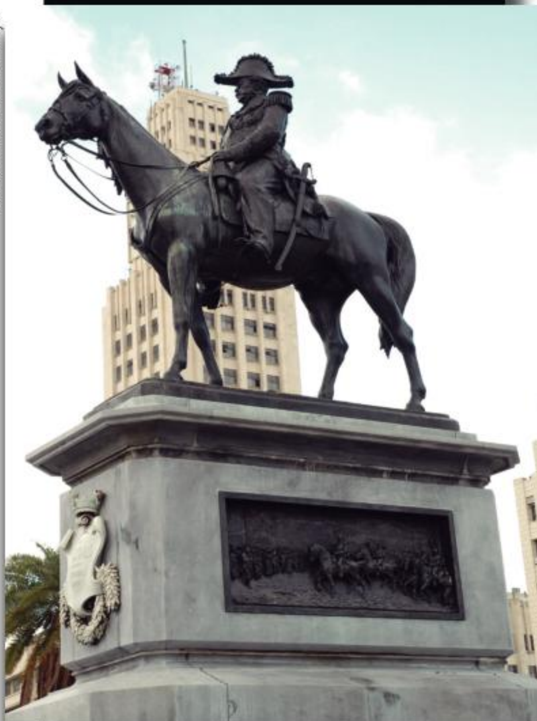
Pantheon de Caxias. Ao fundo, edifício da Central do Brasil

Pantheon. Produzida em bronze, a estátua representa o Duque montado em seu cavalo, em uniforme de Marechal, tendo em sua mão direita um binóculo e em atitude de observação. Apresenta dois baixos relevos no pedestal: a tomada da Ponte de Itororó e a entrada do Exército em Assunção, capital do Paraguai.