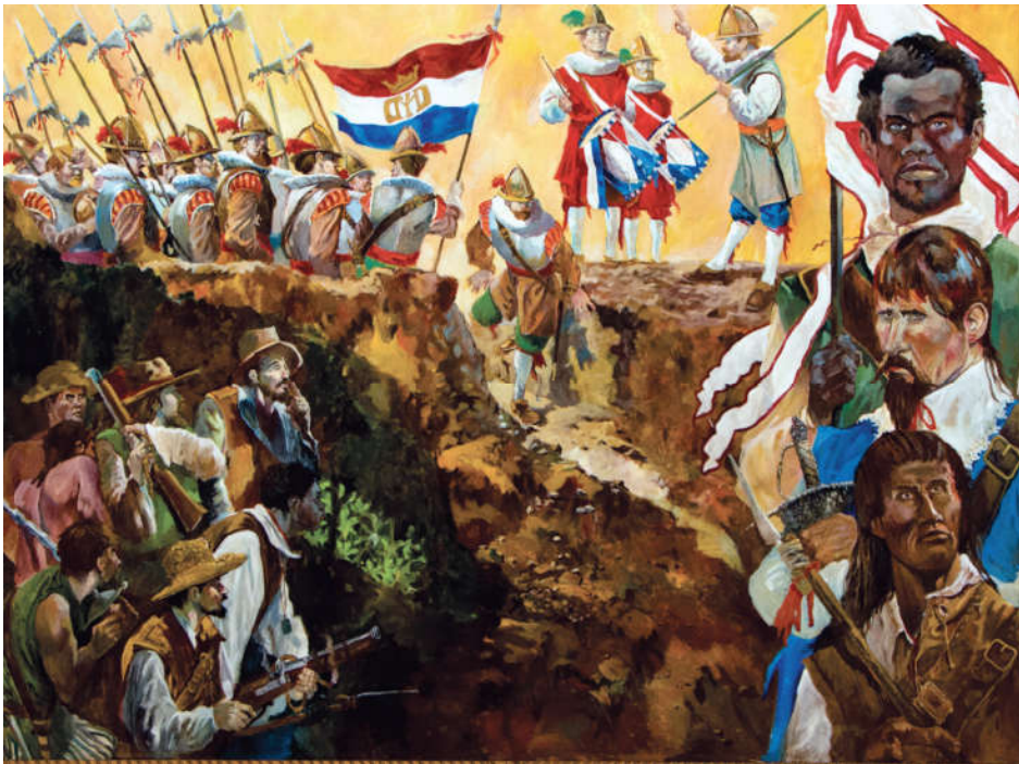
“Batalha de Guararapes” Retrata a formação do Exército Brasileiro – Salão Nobre do Quartel General - Brasília