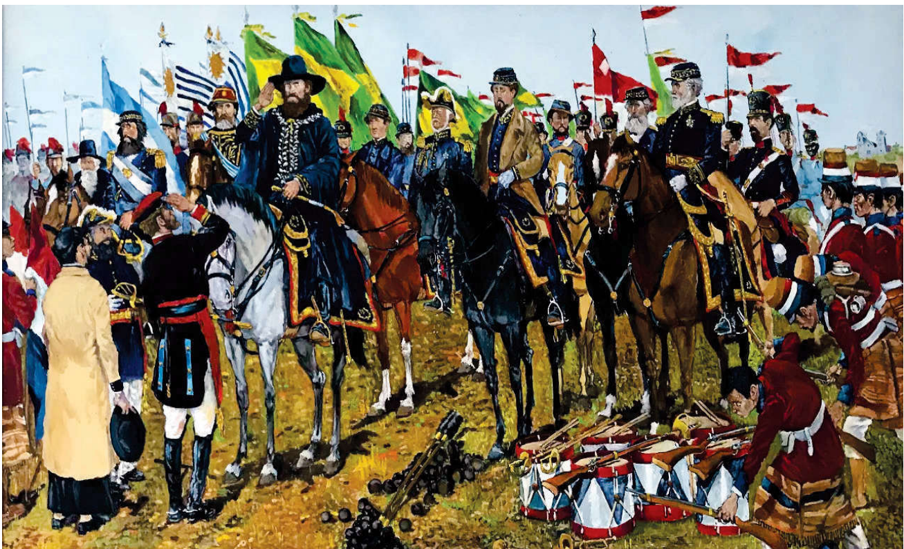
“Rendição de Uruguiana” – 2ª Bda C Mec