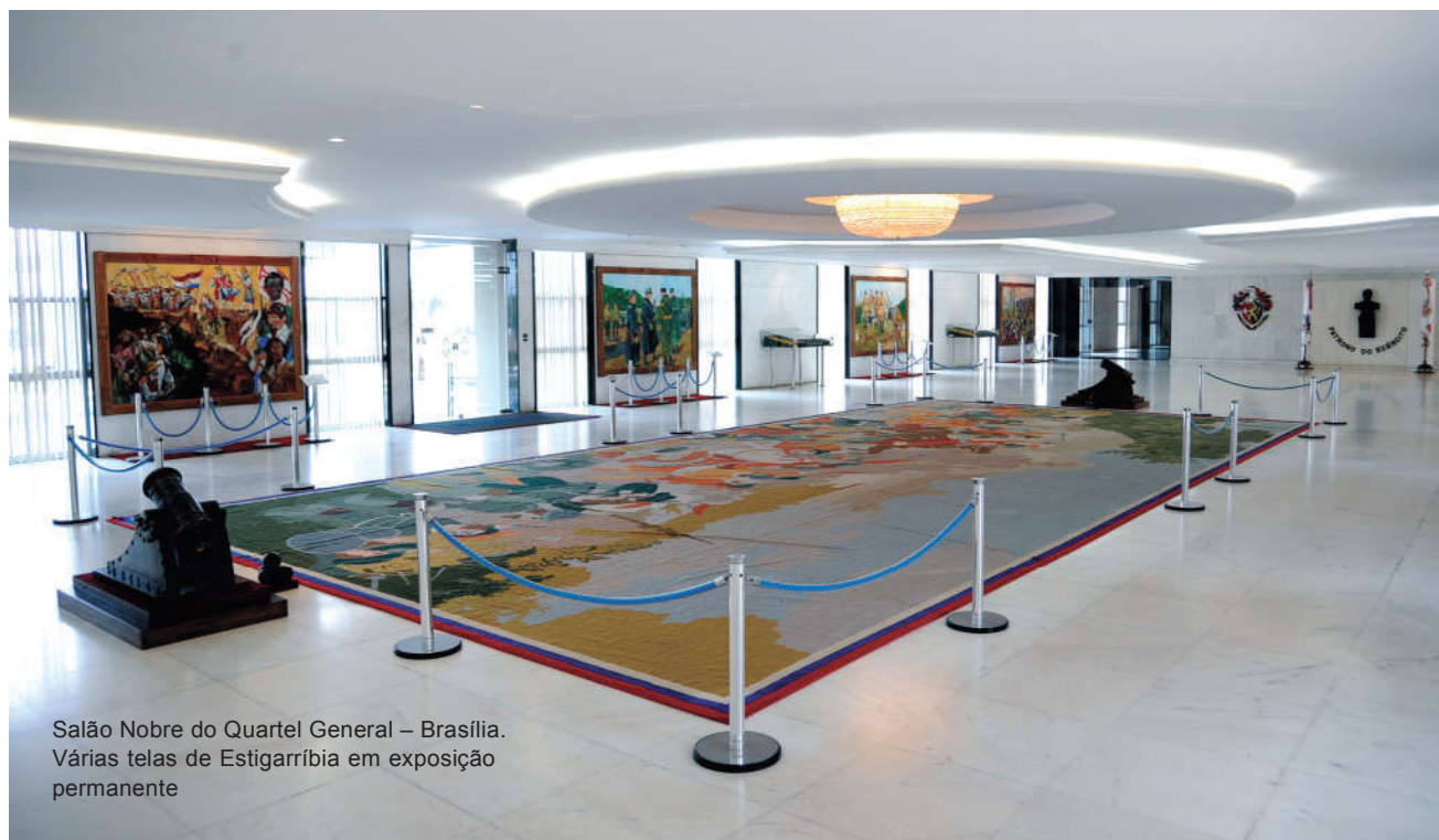
Salão Nobre do Quartel General – Brasília. Várias telas de Estigarríbia em exposição permanente

Conterrâneo e minha referência desde os tempos de alunos do mesmo colégio em João Pessoa, ele sempre brilhante e um ano à frente, caprichei no esboço. Seriam várias vitrines com o que de mais significativo e diferenciado ostentamos nos uniformes, como nossas manicacas, as condecorações, as espadas, os distintivos de OM etc que ele modificou para muito melhor, tornando o Salão Guararapes essa vitrine do Exército. O Gen Ex Zenildo de Lucena, Ministro do Exército, além do apoio irrestrito, pincelou detalhes, atento às suas próprias diretrizes de estímulo às medidas que fortalecessem nossa Memória. No intervalo das janelas, pinturas com cenas à moda de linha do tempo. Elaborei essas pinturas em pequena oficina montada em Igrejinha, cidade próxima a Gramado, aqui no Rio Grande. As molduras foram entalhadas, uma a uma, por talentoso artista de Igrejinha, chamado Oriovaldo Roos, que o Exército conhece por seu apelido, Galã.