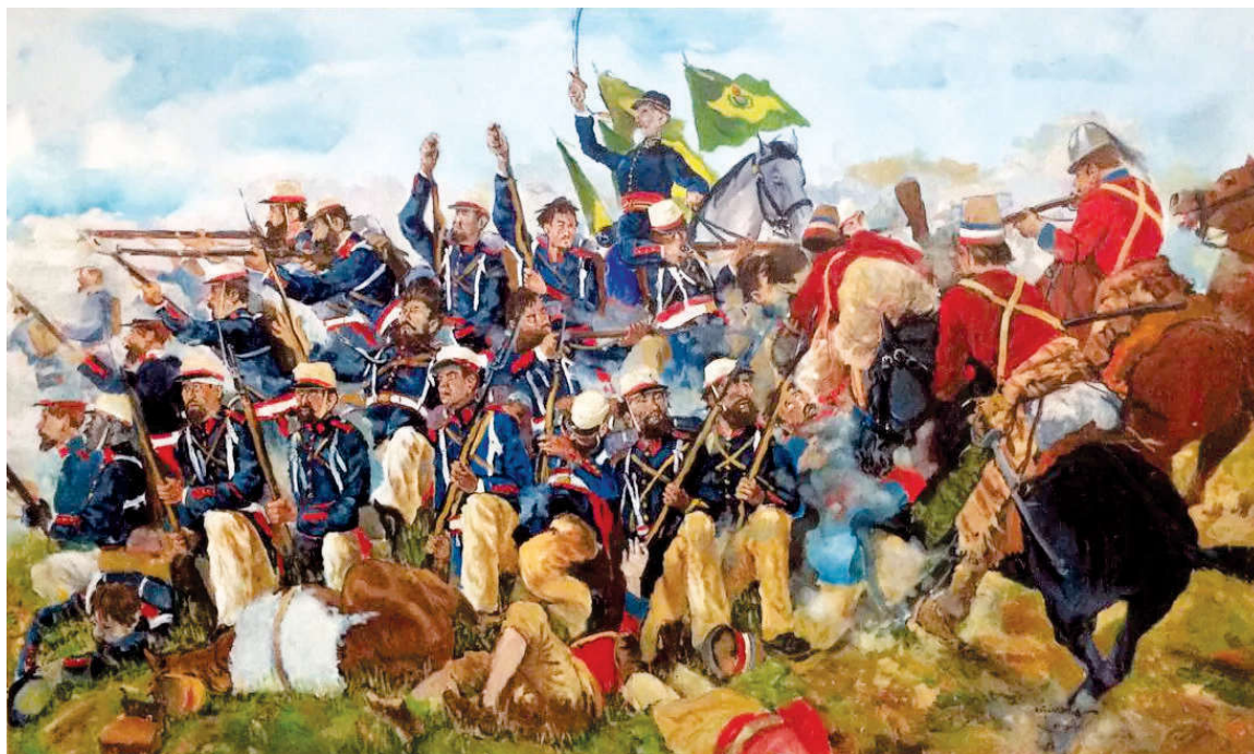
"Batalha de Tuiuti – Sampaio em combate" 10ª Região Militar de Fortaleza - CE

Como fiz a pintura sem conhecer o local da batalha, hoje, acrescentaria um pouco de mato ao ambiente. O detalhe não compromete o conjunto. Mas num outro quadro, ilustrando o que seria aquela passagem de Caxias por