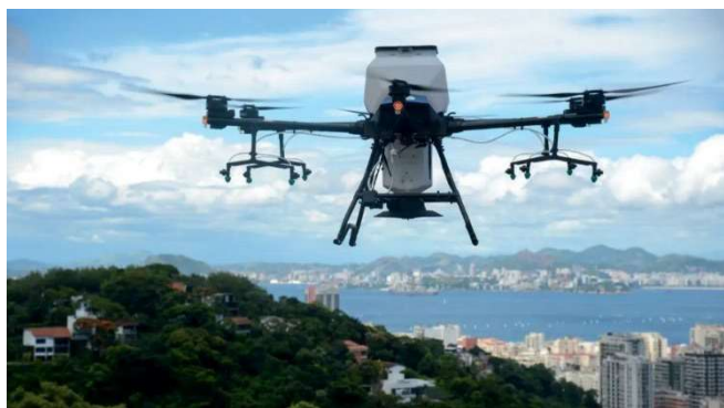
Figura 2 – Drone vigiando favela carioca

cem mil para um milhão de dólares por unidade (Hambling, 2018, p. 45). Apesar dos avanços, uma combinação de custo alto e um suposto "sentimento de ameaça à hegemonia dos pilotos" (Hambling, 2018, p.43) impediu a consolidação do drone como arma principal até o cenário pós-11 de Setembro, quando os EUA transformaram os Predator e Reaper em plataformas de ataque de precisão ( UCAVs ) na Guerra ao Terror (National Air and Space Museum, 2018). No Brasil, durante a Guerra Fria, a tecnologia também se fez presente no campo experimental, com protótipos sendo usados como alvos aéreos em 1983 (ITARC, s.d.).