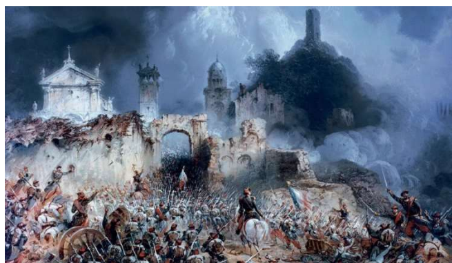
Figura 1 – “O ataque a Solferino”, imagem do livro Lembrança de Solferino

Esses esforços embrionários ganharam robustez filosófica com o Iluminismo, quando surgiu uma doutrina humanista que defende a limitação da guerra aos militares, poupando a população civil. São precursores desse entendimento Jean Jacques Rousseau, na obra “O Contrato Social”, de 1762, e Emmerich de Vattel, na obra “Direito das Gentes”, de 1758. Segundo Deyra (2001, p. 13), esses autores puseram fim à tese da guerra justa e lançaram as bases do moderno Direito da Guerra.