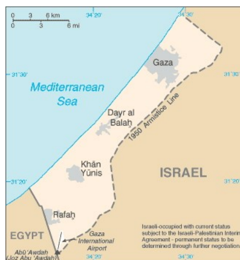
Figura 1 – Mapa da Faixa de Gaza.

A população é de cerca de 1,5 milhão de pessoas, com 99,3% professando a religião muçulmana sunita. É um grande adensamento populacional (4.100 habitantes por km) extremamente pobre, com alta taxa de natalidade (5,6 filhos por mulher), com 80% dos habitantes considerados pobres e 67% da sua mão-de-obra desempregada, possui ingredientes que facilitam grupos radicais, como o Hamas, obter apoio de parte expressiva da população, insatisfeita com as difíceis condições de vida na região.