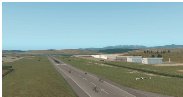
Figura 5 – Modelo de cenário virtual

O software de simulação Xplane11, sob a análise técnica, foi escolhido como motor da simulação. Essa escolha deu-se pelo fato de ele permitir: a) ajustes diversos nas variáveis de simulação; b) inserção de recursos adicionais de funcionamento por meio da programação de plugins ; c) importação de veículos e cenários modelados a partir de outros softwares , proporcionando uma personalização do ambiente simulado (figuras 5 e 6).