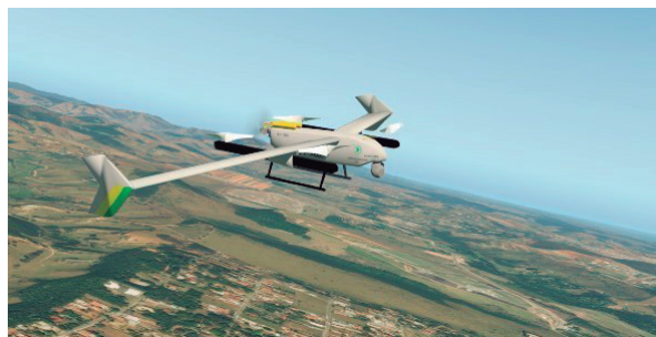
Figura 4 – Xplane11 ARP Modelo Virtual

O software de simulação Xplane11, sob a análise técnica, foi escolhido como motor da simulação. Essa escolha deu-se pelo fato de ele permitir: a) ajustes diversos nas variáveis de simulação; b) inserção de recursos adicionais de funcionamento por meio da programação de plugins ; c) importação de veículos e cenários modelados a partir de outros softwares , proporcionando uma personalização do ambiente simulado (figuras 5 e 6).