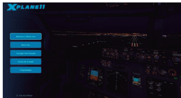
Figura 3 – Xplane 11 Software de simulação