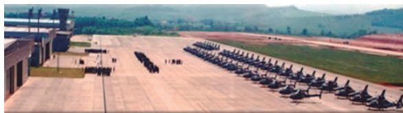
Figura 1 – Imagem do Pátio de Aeronaves – Setor Norte – Aviação do Exército

primordial de proporcionar aeromobilidade à Força Terrestre. Ela carrega consigo o designio de ser um vetor de modernidade, constituindo-se em um polo de domínio, difusão de tecnologia e doutrina desse segmento da guerra moderna. Atualmente, dispõe, no contexto de suas operações, de uma frota de aproximadamente 94 helicópteros, entre os modelos Esquilo/Fennec, Pantera, Cougar, Jaguar e Black Hawk ( figura 1 ).