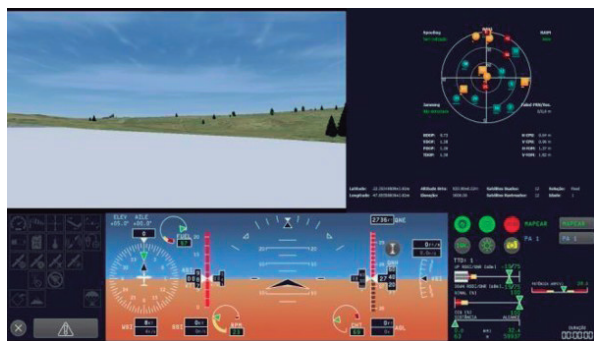
Figura 6 – ECS – Simulador SARP Cat 2

Convém destacar que o desenvolvimento dos displays da estação de controle de solo ocorreu a partir da linguagem de programação “LUA”, comumente utilizada em programação de sistemas embarcados.