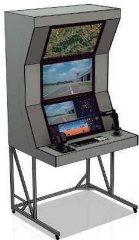
Figura 2 – ECS Simulador SARP Cat 2

Esse simulador SARP Cat 2 é composto por uma estação de controle de solo (figura 2), um software de simulação (figura 3) e um modelo virtual do ARP – Aeronave Remotamente Pilotada (figura 4), todos os componentes representativos do sistema real.