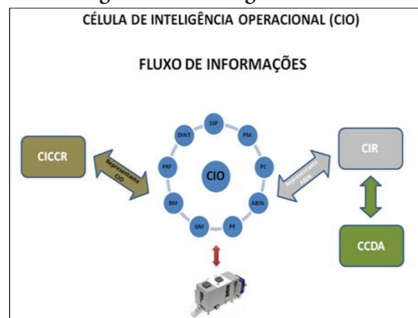
Fluxograma 4 - Fluxograma do CIO

Assim, a Oficina de Inteligência em Minas Gerais era composta por analistas da ABIN, Agência de Inteligência da Polícia Federal, Agência de Inteligência da Polícia Rodoviária Federal, da Diretoria de Informações e Inteligência da Polícia Civil de Minas Gerais (DIIP/PCMG), da Diretoria de Inteligência da Polícia Militar de Minas Gerais (DINT/PMMG), Agência de Inteligência da Subsecretaria de Assuntos Prisionais da Secretaria de Estado de Defesa Social (AI/SUAPI/SEDS), Agência de Inteligência da Guarda Municipal de Belo Horizonte/MG (AI/GMBH), representação da Inteligência da 4ª Região Militar do Exército Brasileiro, sediado em Belo Horizonte, dentre outros convidados eventuais. Sendo um dos fluxos demonstrado na figura a seguir: