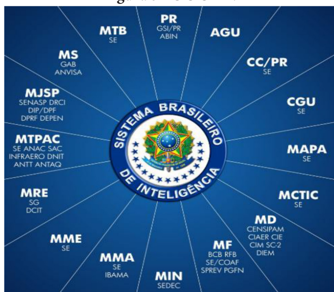
Figura 3 - O SISBIN

Essas técnicas podem ajudar os analistas a mitigar as limitações cognitivas comprovadas, superando algumas das armadilhas analíticas conhecidas, e explicitamente confrontar os problemas associados a modelos mentais inquestionáveis (também conhecidos como mentalidades). Eles ajudam analistas a pensar mais rigorosamente sobre um problema analítico e garantir que preconceitos e pressupostos não sejam tornados como garantidos, mas explicitamente examinados e testados (tradução livre).