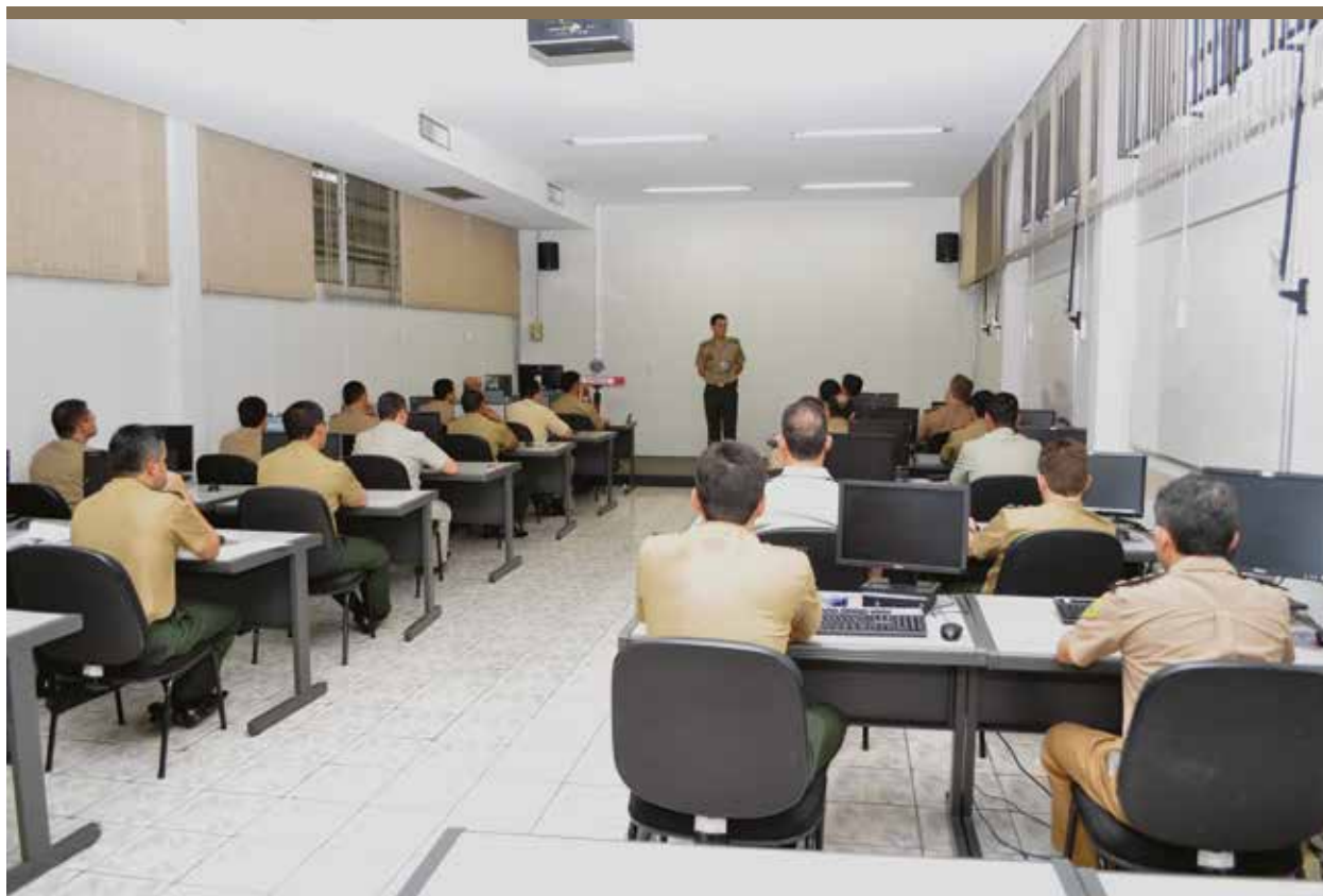
Foto 3 - Instrução em Sala de Aula

de cargos e funções de analista e chefe de Agências de Inteligência. Nesse ano, a Escola passou, também, a cooperar na especialização de recursos humanos das Forças Singulares, das Polícias Militares e de militares oriundos de Exércitos de países amigos, com os quais o Exército Brasileiro mantém intercâmbio de Inteligência.