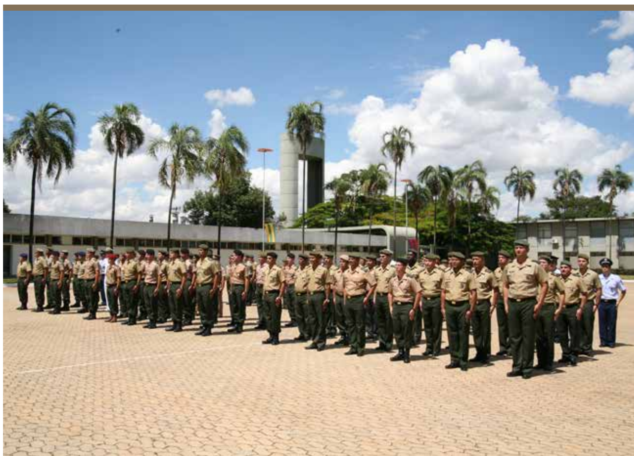
Foto 10 - Formatura de conclusão de curso

deste Estabelecimento de Ensino militares das Forças Armadas, das Nações Amigas e das Forças Auxiliares, bem como, autoridades e personalidades civis, sendo que o maior percentual de especializados pertence ao Exército Brasileiro.