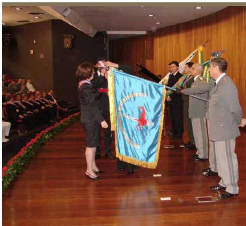
Foto 6 - Entrega da Insígnia de Bandeira da Medalha Ordem do Mérito do Ministério Público Militar

A mais elevada distinção honorífica do Exército Brasileiro, a Insígnia de Bandeira da Ordem do Mérito Militar condecorou o Estandarte Histórico da EsIMEx, no ano de 2012, como reconhecimento pelos bons serviços prestados por esse Estabelecimento de Ensino no diuturno esforço para especializar militares e civis para o desempenho de funções no Sistema de Inteligência nas respectivas Instituições.