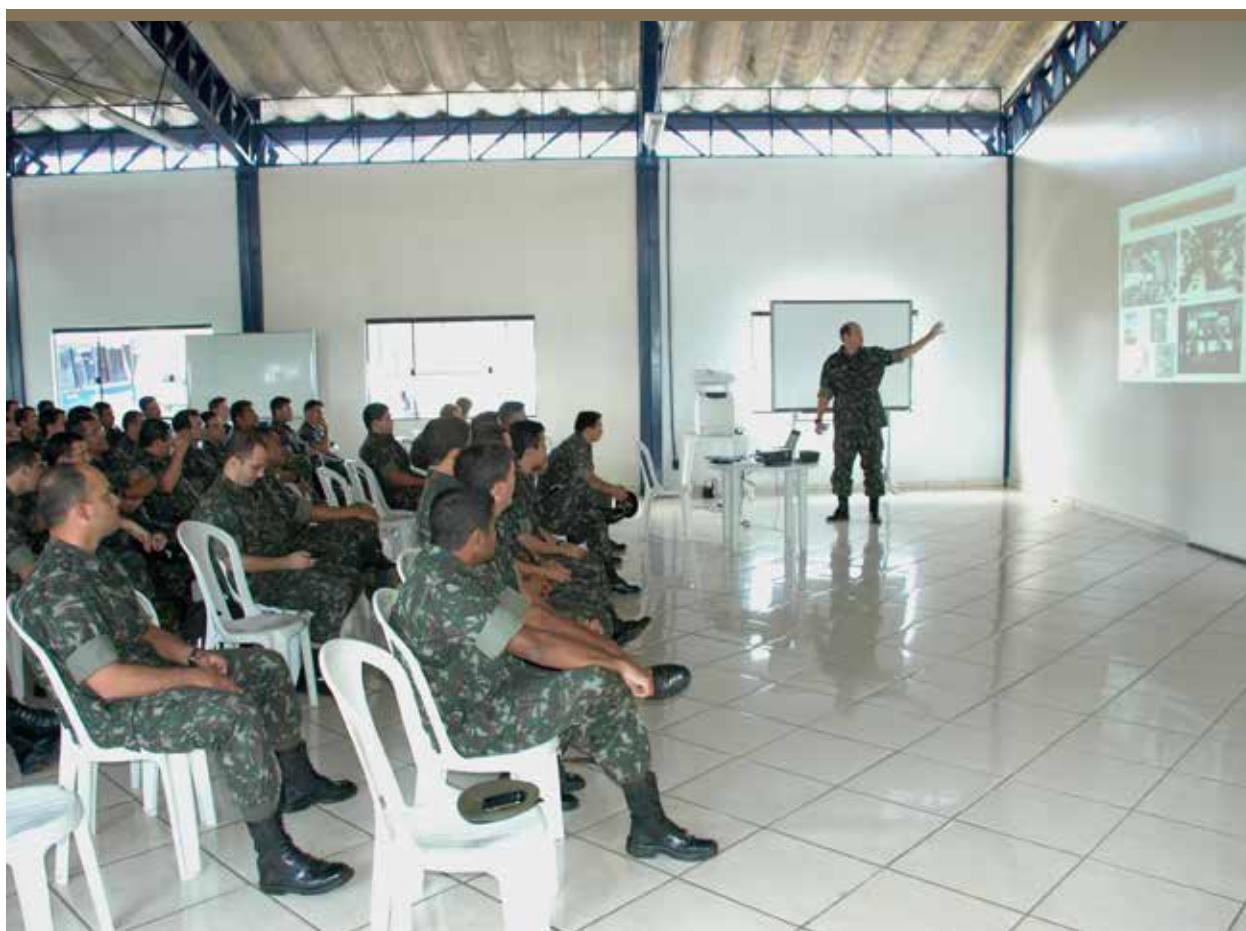
Foto 7 - Exercício de Inteligência nas Operações Militares

A Escola propõe um trabalho baseado nas diferenças individuais e na consideração das peculiaridades de cada discente, mas preocupando-se em desenvolver as habilidades de trabalho em equipe e de relação interpessoal, inerentes à Atividade de Inteligência Militar. O ensino proposto segue a linha “doutrina - diálogo - experimentação - compreensão” e busca a participação baseada na relação direta da teoria com a prática por parte do discente.