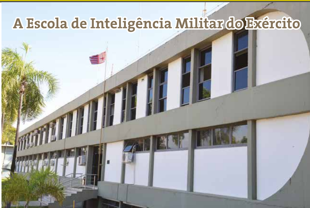
Foto 1 - Vista frontal da EsIMEx