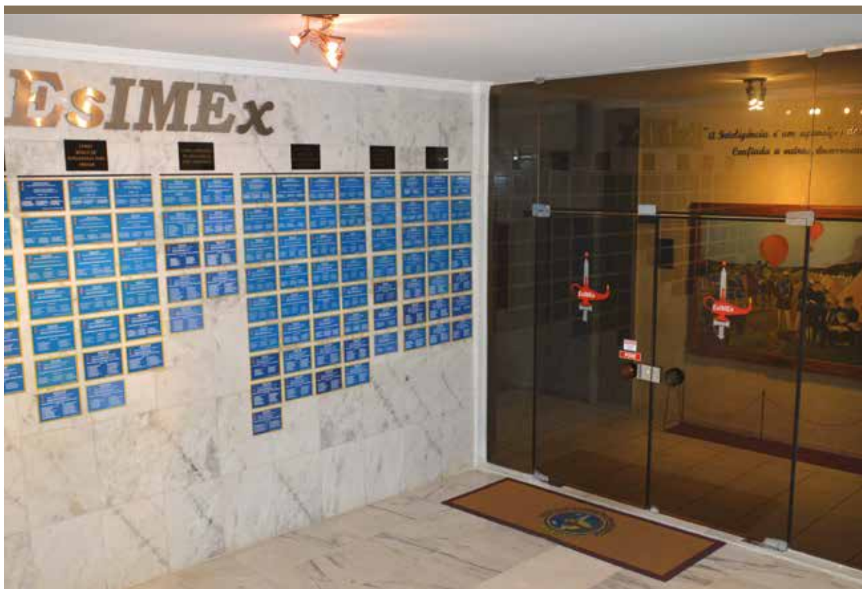
Foto 2 - Vista da entrada principal

Para efeitos de orientação pedagógica, a EsIMEx é vinculada ao Departamento de Educação e Cultura do Exército (DECEX), por intermédio da Diretoria de Educação Técnica Militar (DETMil).