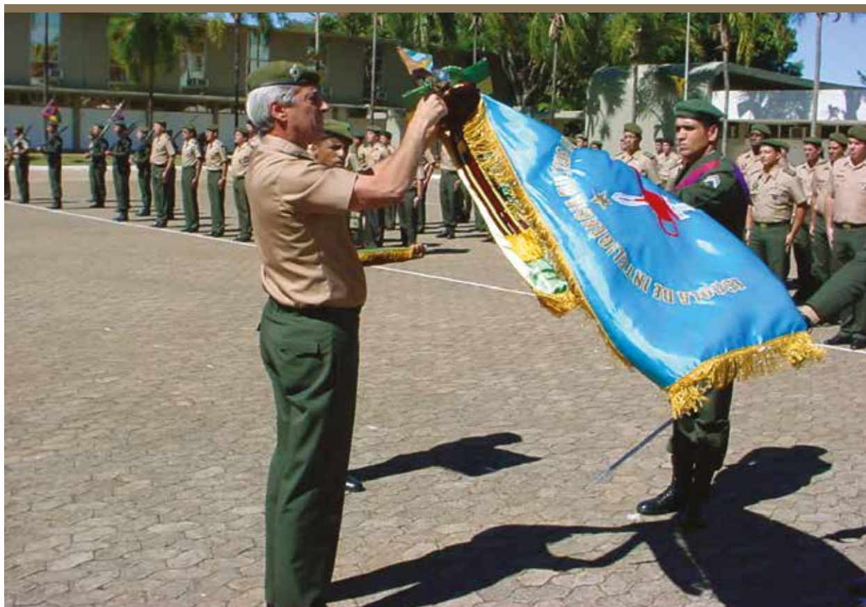
Foto 5 - Entrega da Insígnia de Bandeira da Medalha Marechal Trompowsky

A mais elevada distinção honorífica do Exército Brasileiro, a Insígnia de Bandeira da Ordem do Mérito Militar condecorou o Estandarte Histórico da EsIMEx, no ano de 2012, como reconhecimento pelos bons serviços prestados por esse Estabelecimento de Ensino no diuturno esforço para especializar militares e civis para o desempenho de funções no Sistema de Inteligência nas respectivas Instituições.