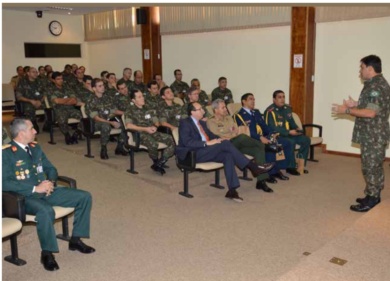
Foto 9 - Intercâmbio com militares de Nação Amiga

A consecução de todos os objetivos anteriores exige um relacionamento estreito da Inteligência Militar com a comunidade de Inteligência alocada nas diversas esferas do poder do Estado Brasileiro. Para tanto, a EsIMEEx adota estratégias e instrumentos para aprofundar esse relacionamento com a oferta de estágios e palestras para civis e militares.