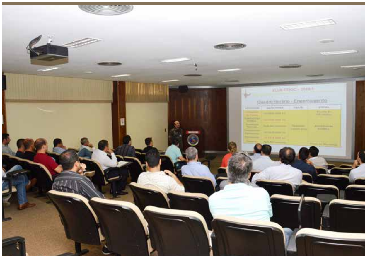
Foto 4 - Estágio para órgãos civis

Oficiais e o de Sargentos. Esses Cursos representam uma solução inovadora no âmbito do Exército, pois foram concebidos para funcionar em dois Estabelecimentos de Ensino distintos, cabendo à EsIMEx os assuntos curriculares de Inteligência Militar e ao Centro de Instrução de Guerra Eletrônica (CIGE) a docência de assuntos relativos à exploração e ao domínio do espectro eletromagnético.