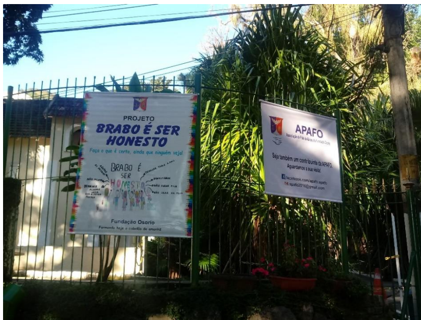
Fig.11: Banner