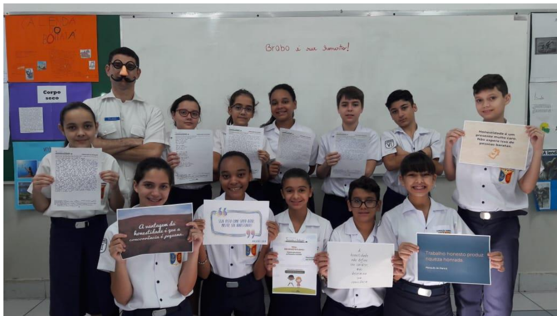
Fig. 5: Alunos do Sexto Ano com seus cartazes e textos em 2018