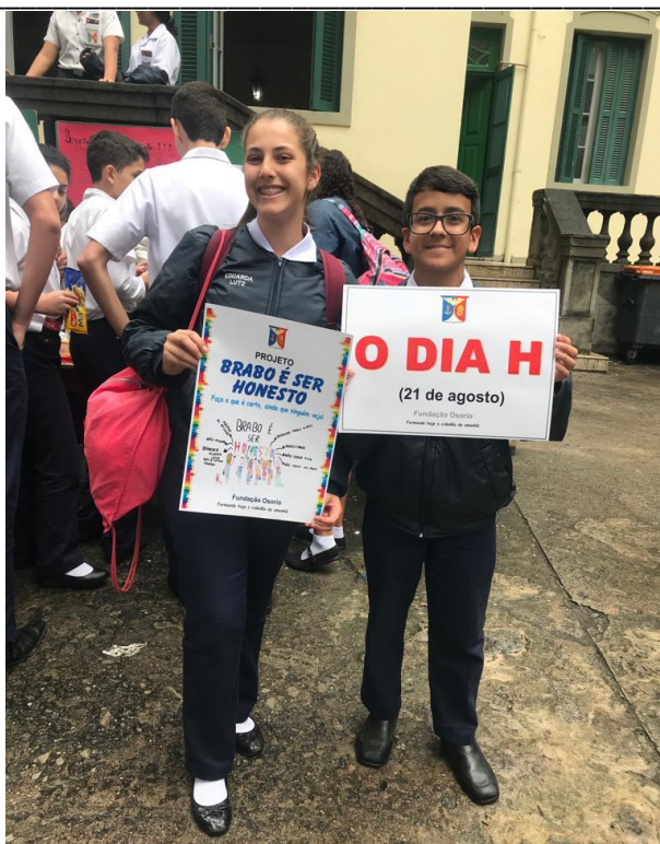
Fig.33: alunos do sétimo ano divulgando a honestidade

Por fim, para um Brasil melhor e menos corrupto, a conscientização e a participação de todos os setores da sociedade são imprescindíveis. Ademais, com comprometimento, disciplina e fé será possível erradicar essa crise moral e ética que assola o país. Somente com o cultivo de valores conseguir-se-á, mesmo diante de tantas dificuldades, construir a base de uma sociedade saudável alicerçada na dignidade, no respeito e na HONESTIDADE. Certamente, esse é o país que queremos deixar para as próximas gerações.