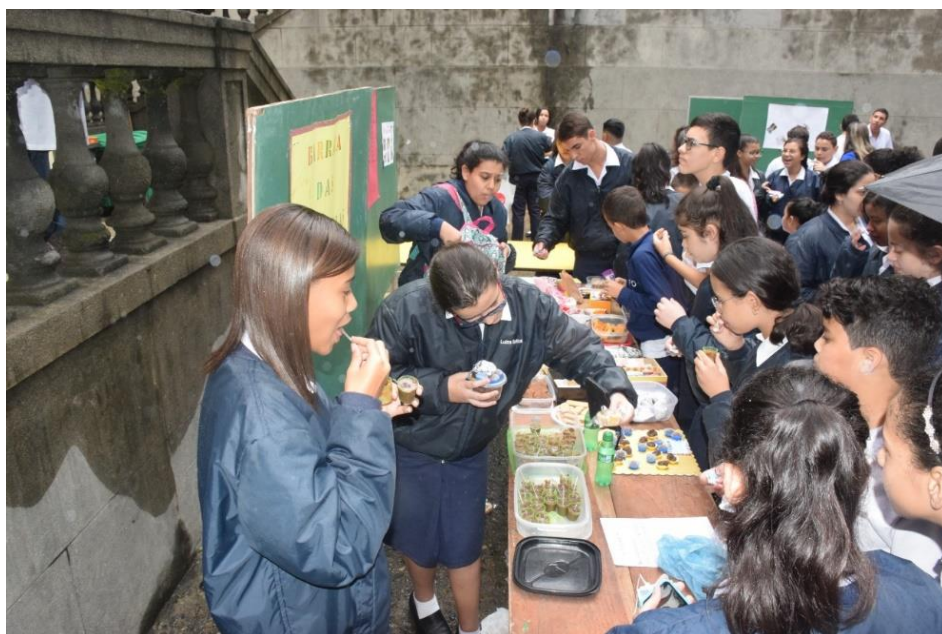
Fig.24: O Dia H