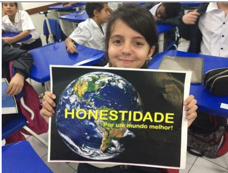
Fig. 15: aluna do sexto ano