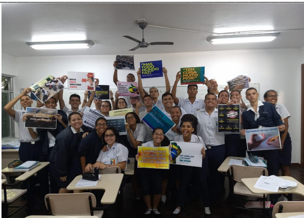
Fig.17: alunos do terceiro ano do Ensino Médio