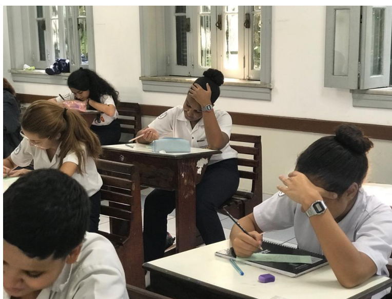
Fig.30: avaliação sem fiscal – nono ano