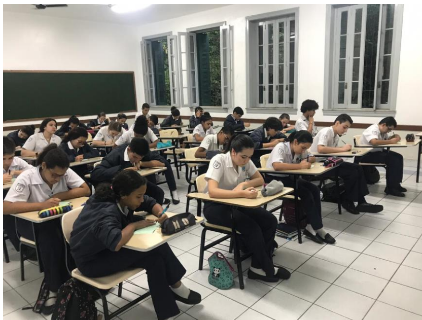
Fig.29: avaliação sem fiscal – nono ano