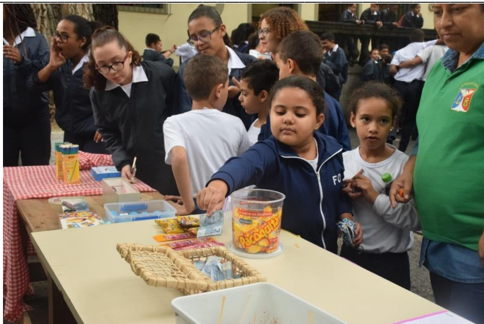
Fig.23: crianças do primeiro segmento comprando sem a presença de vendedor