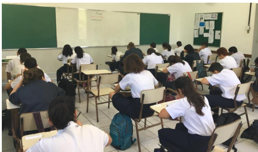
Fig. 7: Avaliação sem fiscal em 2018