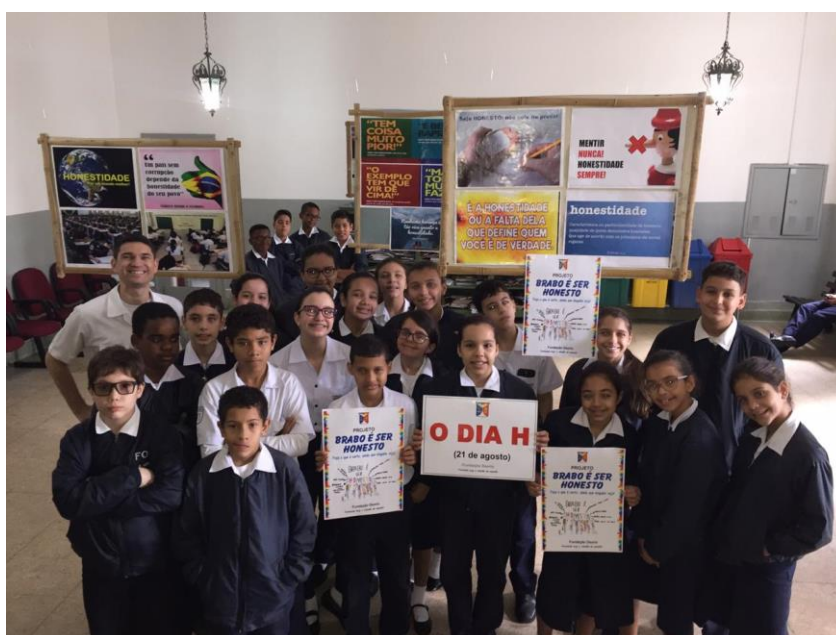
Fig. 12 : Exposição de cartazes motivadores à honestidade