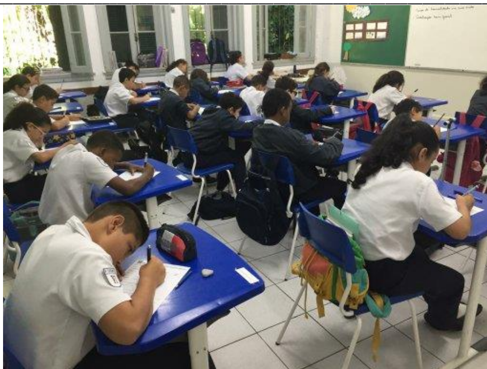
Fig.31: avaliação sem fiscal – sexto ano