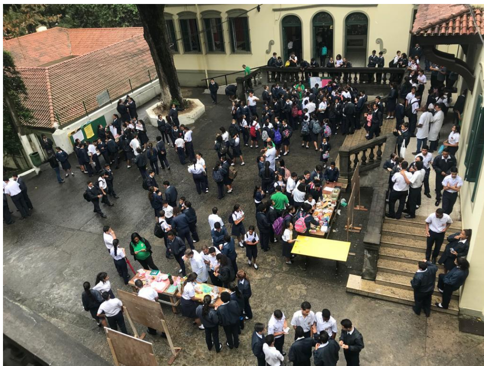
Fig.26: O Dia H – Foto aérea