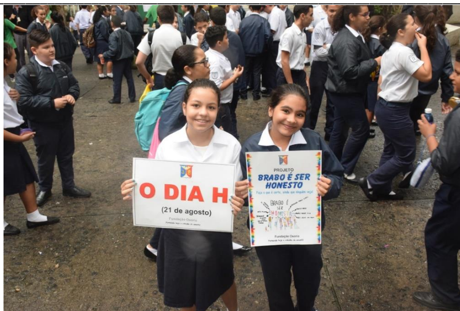
Fig.25: alunas do sexto ano no Dia H