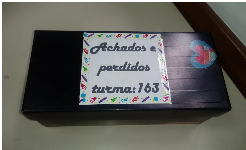
Fig.21: Caixinha de achados e perdidos da turma 163