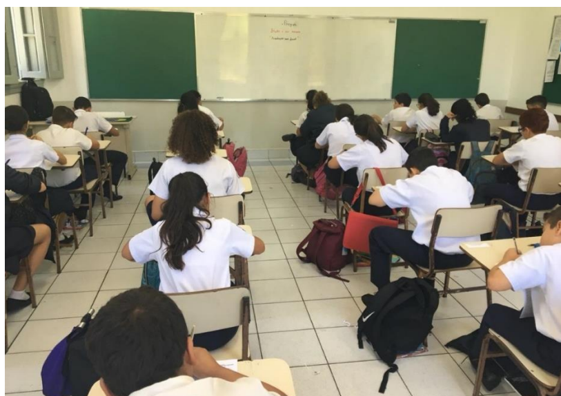
Fig. 6: Avaliação sem fiscal em 2018

iriam colar, pois eram pessoas honestas, eram brasileiros de valor. Foi um sucesso, eles mesmos se vigiaram e saíram orgulhosos de si mesmos naquele dia. Essa avaliação chegou aos ouvidos dos familiares e dos colegas de forma bastante positiva. Essa atividade inovadora potencializou o trabalho desenvolvido pelo Projeto BRABO É SER HONESTO. Outros professores se sentiram motivados e também efetuaram avaliações sem fiscal nas turmas de sétimo, oitavo e nono anos do Segundo Segmento do Ensino Fundamental. Foi um sucesso. Por fim, o índice de “cola” em testes e provas foi reduzido a zero no quarto bimestre de 2018.