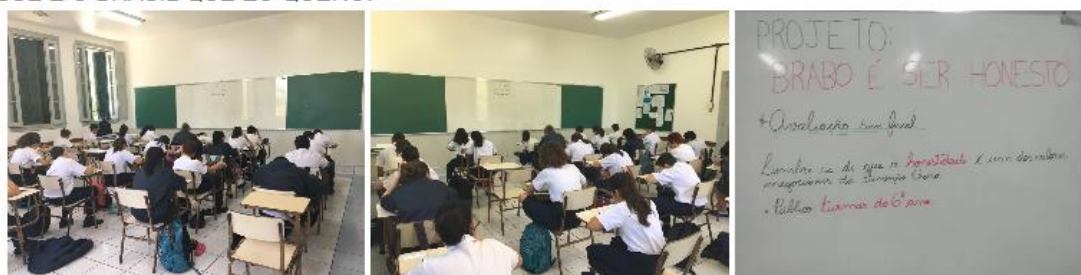
Fig. 8: Divulgação do projeto