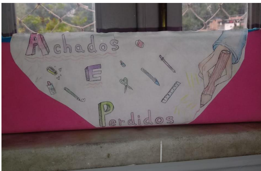
Fig.22: Caixinha de achados e perdidos da turma 161