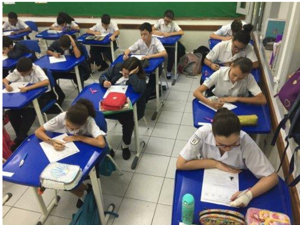
Fig.32: avaliação sem fiscal – sexto ano